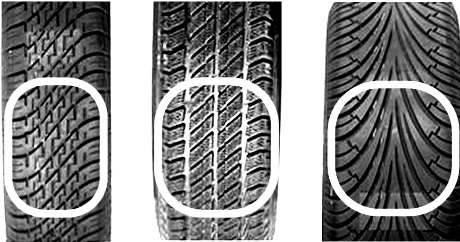
Rys. 2. Rowki bieżnika ukształtowane tak, aby jak najłagodniej wchodziły w ślad styku z nawierzchnią

do prowadzenia symulacji wolnego manewrowania charakterystycznego dla parkingów, stacji paliw, punktów poboru opłat autostradowych, placów manewrowych na terminalach itd.