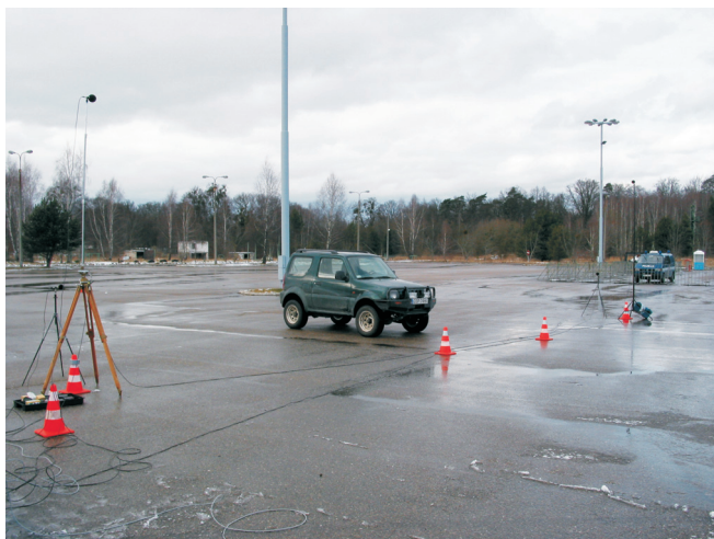
Rys. 3. Pomiary hałasu podczas podstawowych manewrów parkowania (na mokrej nawierzchni) Fig. 3. Noise measurements during "basic parking maneuvers" on damp road surface

Moc akustyczna emitowana podczas wolnej jazdy określana była dla samochodów osobowych za pomocą modelu VENOM, który powstał na Politechnice Gdańskiej specjalnie do symulowania hałasu samochodów w najróżniejszych warunkach ruchu. Ponieważ jednak, jak na razie, model ten nie obejmuje samochodów ciężarowych i autobusów, więc wykonane zostały specjalne, uzupełniające badania hałasu dla tych pojazdów.