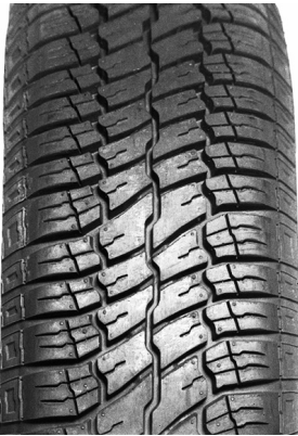
Rys. 1. Bieżnik opony z wyraźną randomizacją (poszczególne elementy różnią się wielkością i kształtem)

Pomimo dużych wysiłków zmierzających do zmniejszenia hałasu drogowego, jest on nadal największym źródłem hałasu w krajach rozwiniętych. Duży postęp w budowie pojazdów jaki nastąpił w drugiej połowie dwudziestego wieku spowodował, że tradycyjne źródła hałasu pojazdów takie jak silnik, układ wydechowy, układ ssący i przekładnie stały się znacznie cichsze i przy wyższych prędkościach przestały dominować w ogólnym hałasie pojazdów. Tak dużego postępu nie udało się uzyskać w zakresie hałasu opon samochodowych toczących się po nawierzchniach drogowych. Polepszoano charakterystyki widmowe hałasu opon poprzez randomizację rzeźby bieżników (rys. 1), zoptymalizowano układ rowków (rys. 2), ale całkowity poziom mocy akustycznej emitowanej podczas toczenia kół samochodowych w najlepszym razie zmniejszył się bardzo nieznacznie.