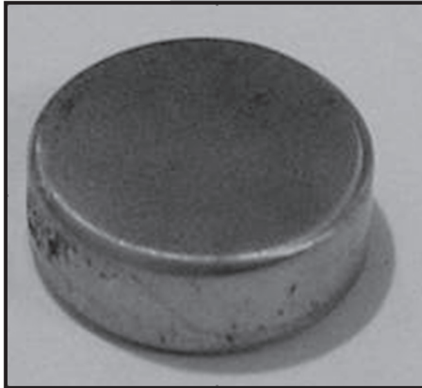
RYS.1 Widok próbki wyciętej z implantu FIG.1 The view of an implant sample

The silver ions have ability to join the bacteria surface. Low density of silver ions Ag^+ influence the protons through the bacteria surface, which results in total destruction of the cell. Antibacterial activity of silver remains in proportion with the density of silver ions Ag^+ in the environment [3].