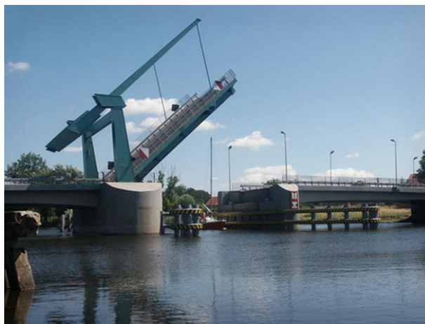
Rys. 6. Most w Drewnicy na Szkarprawie (skośne usytuowanie mostu w stosunku do osi rzeki).

Na podstawie przytoczonych powyżej dwóch przekładów mostów w Kępkach i Drewnicy wybudowanych w ostatnich latach można zauważyć powtarzający się scenariusz budowania mostów w województwie pomorskim, które powstają z całkowitym lekceważeniem użytkowników dróg wodnych i bez poczucia odpowiedzialności za potrzeby żeglugi śródlądowej, przynosząc tym samym polskiej gospodarce wymierne straty.