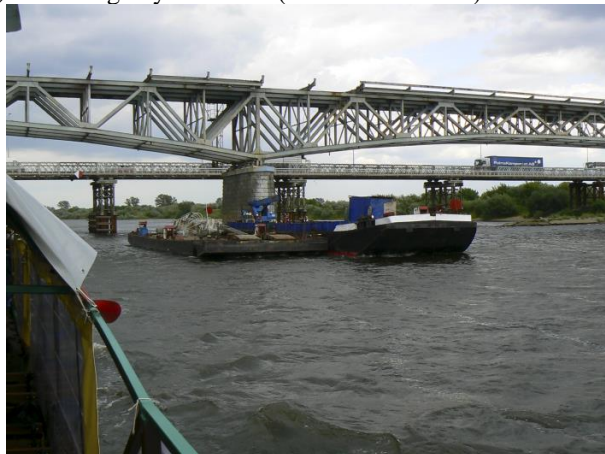
b) most drogowy Chełmno (w czasie remontu)