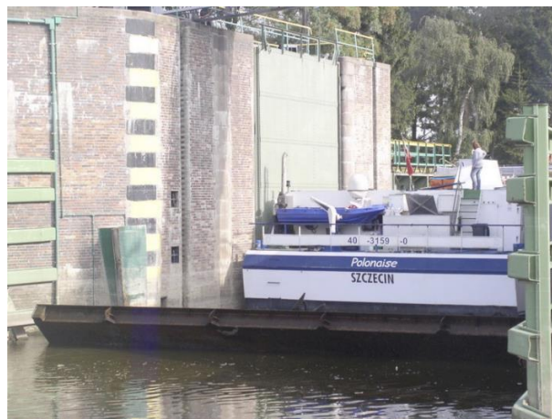
Rys. 3. Śluzowanie w przedłużonej śluzie Gdańska Głowa na Szkarpawie