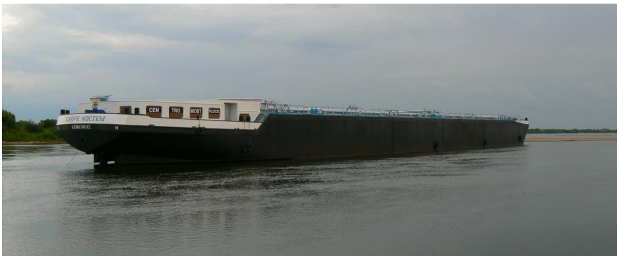
Rys. 2. Zbiornikowiec 110 x 11,45 x 5,40 m splewany Wisłą ze stoczni rzecznej w Płocku na mieliźnie pod Korzeniewem (fot. W. Sterpejkowicz-Wersocki)

Na podstawie pomiarów wykonanych w listopadzie 2006 r. przez RZGW na odcinku od km 732,0 do 807,0 głębokości wahają się od 0,9 m do 4,7 m, przy czym średnia głębokość dla tego odcinka to 1,98 m.