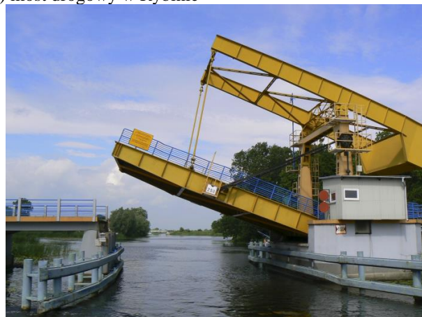
b) most drogowy w Rybinie