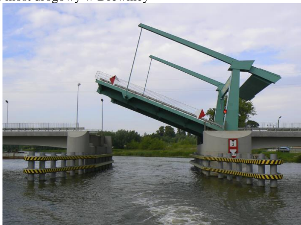
a) most drogowy w Drewnicy