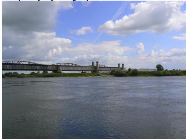
Rys. 1. Przeprawy mostowe nad Wisłą (fot. W.Sterpejkowicz-Wersocki)

Pomimo tego, wydawać by się mogło, że w dolnym biegu Wisły, największej polskiej rzeki, żegluga nie powinna napotykać na przeszkody, to największym problemem swobodnej żeglugi na tym odcinku rzeki są niewystarczające głębokości, występujące najczęściej w okresie letnim oraz jesiennym. Głębokości występujące w szlaku żeglownym w okresie niżówek są często mniejsze od 1,0 m, co sprawia, że tylko jednostki pływające o małym zanurzeniu są w stanie uprawiać żeglugę, a i to wymaga dużego doświadczenia.