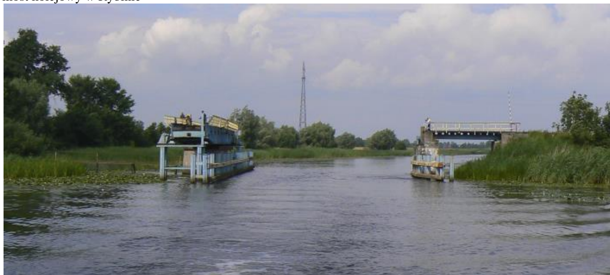
Rys. 4. Mosty na Szkarpawie