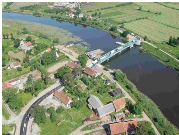
Rys. 5. Most w Kępkach na Nogacie (prześwit zaledwie 330 cm nad WWŻ), (fot. P. Salecki)

Na Szkarprawie nowy most w Drewnicy na początku został zaprojektowany z rozmachem, jako dwuczęściowa zwodzona konstrukcja, o szerokości przejścia kilkunastu metrów. Przeprawa została zaprojektowana nieco skośnie w stosunku do osi rzeki, ale duża szerokość między przęsłami miała sprawić, iż wszystkie jednostki przepłyną pod mostem bez problemów. Niestety, finalny projekt został "okrojony", most składa się tylko z jednego podnoszonego przęsła. Przy zmianie nie pomyślano jednak o tym, iż poprowadzenie przeprawy ukośnie w stosunku do rzeki, w przypadku zwężenia szerokości przęsła stanowić może bardzo poważny problem. Przepływając teraz pod mostem długie jednostki płyną bowiem prosto na brzeg rzeki i nie mają dostatecznie dużo miejsca na manewr. Zasadniczy problem tkwi w tym, że światło mostu ma zaledwie 12,5 metra szerokości, co w konsekwencji oznacza, że nie przepłyną tamtędy bezpiecznie statki dłuższe niż 57 m, nie mówiąc o zestawach barek osiagających ponad 100 m. Musiałyby one jakimś sposobem zgiąć się w środku, bo już ok. 40 m za mostem znajduje się brzeg rzeki. Występuje tu ten sam problem, co w przypadku mostu w Kępkach na Nogacie, gdyż most w Drewnicy, zaprojektowano dla drogi wodnej II klasy. Tymczasem, dla Szkarpawy, zgodnie z cytowanym wyżej Rozporządzeniem Rady Ministrów w sprawie klasyfikacji śródlądowych dróg wodnych (Dz.U. Nr 77 z 2002 r., poz. 695), jako parametry projektowe dla powinno się przyjmować wartości jak dla klasy III.