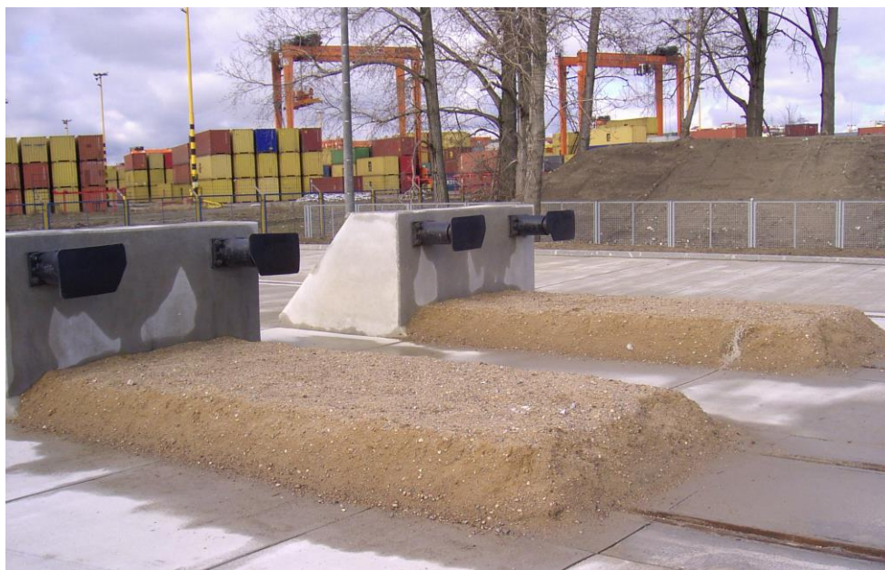
Rys.6. Kozło oporowe o konstrukcji żelbetowej z zasypką piaskową

Na większości bocznic kolejowych mamy do czynienia z bardzo małymi prędkościami przetaczania składów wagonowych wynoszącymi zazwyczaj 5-10 km/h. Należy zatem sprawdzić, czy zaprojektowana grubość i długość zasypki pozwoli na zatrzymanie wagonów o znanej masie i prędkości maksymalnej.