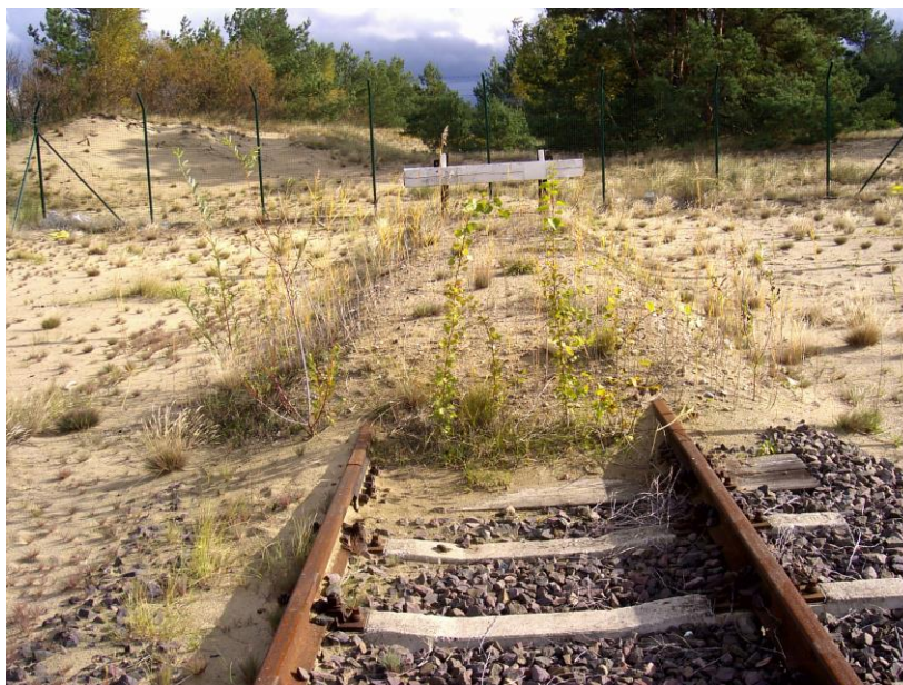
Rys. 7. Koziół oporowy z kształtowników stalowych z zasypką piaskową