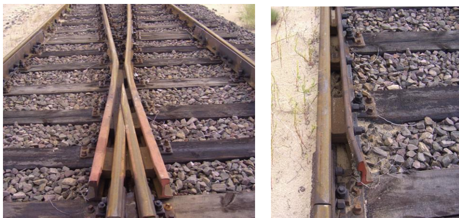
Rys.4. Widok na krzyżownicę (z lewej) i kierownicę (z prawej)

krzyżownicy, typ iglicy oraz fotografie poszczególnych elementów mających wpływ na bezpieczeństwo, tj. zwrotnicy, szyny łączących i krzyżownicy (Rys.4 i 5) .