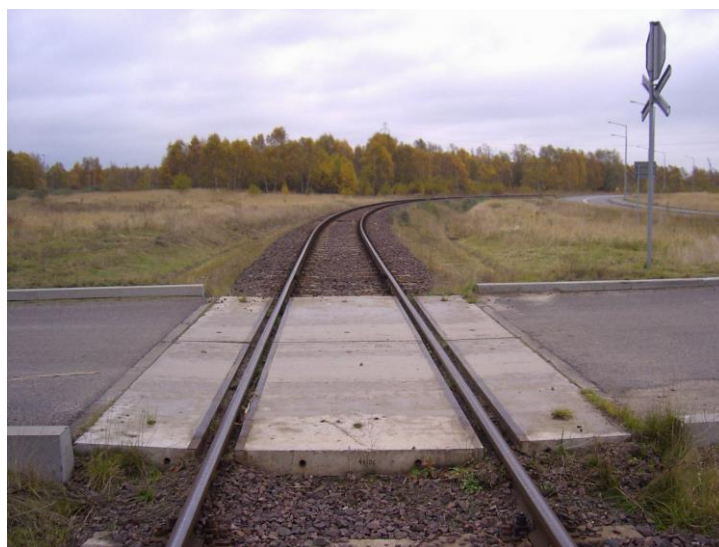
Rys. 2. Widok przejazdu kolejowego na skrzyżowaniu z drogą kołową