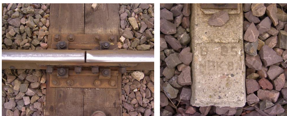
Rys.1. Widok połączenia szyn łubkami (z lewej) i podkładu strunobetonowego INBK 8N wyprodukowanego w 1985 r. (z prawej)

W czasie oględzin torów kolejowych należy wykonać dokumentację fotograficzną, która pozwoli na porównanie stanu istniejącego z projektowanym. Szczególną uwagę należy zwrócić na elementy konstrukcyjne nawierzchni kolejowej, np. połączenia elementów nawierzchni, nietypowe rozwiązania (nawierzchnia bezpodsypkowa, nawierzchnia na wagach), wady konstrukcyjne i wykonawcze, rok produkcji, itp.