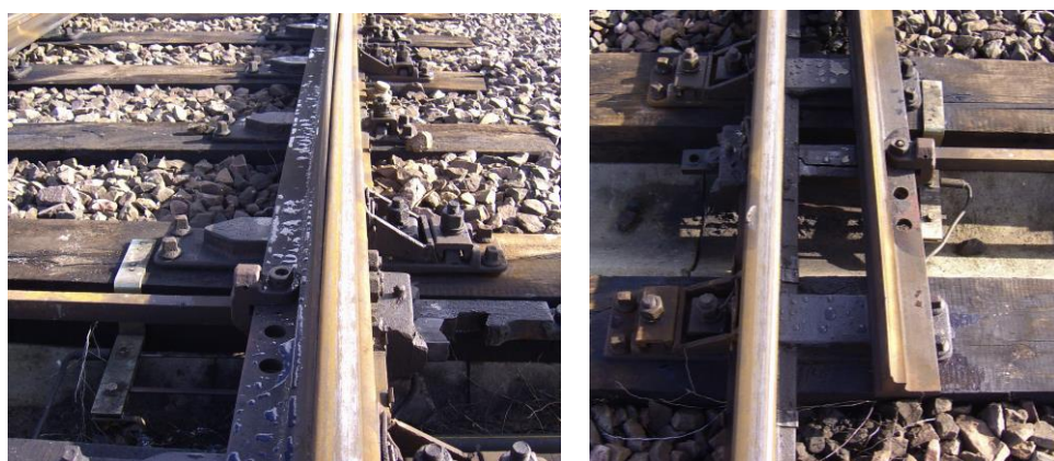
Rys.5. Widok na iglicę prawą prostą (z lewej) i iglicę lewą łukową(z prawej)

Badania rozjazdów kolejowych powinny obejmować [10]: