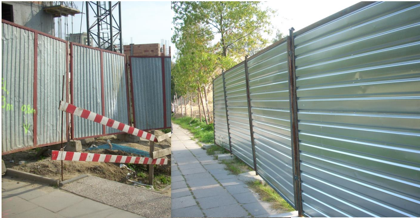
Fot 2. Ogrodzenia placu budowy wykonane w tej samej technologii różniące się estetyką wykonania. Fot. R. Okraszewska 2010