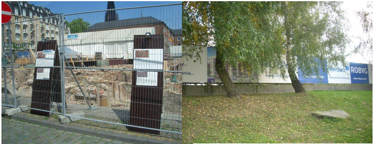
Fot 7. Ogrodzenie terenu prac rekonstrukcyjnych dzielnicy żydowskiej w centrum Kolonii.