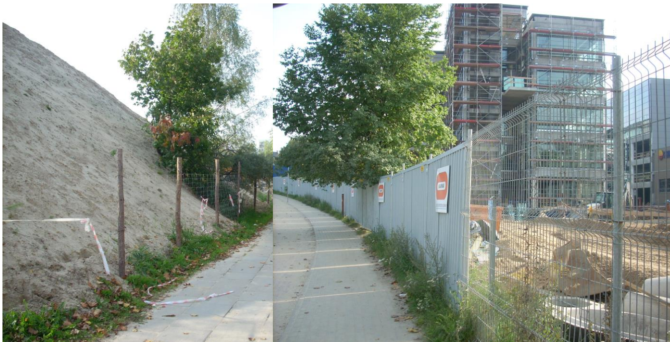
Fot 3. Ażurowa struktura ogrodzenia zabezpiecza plac budowy i jednocześnie pozostawia przechodniom wrażenie otwartej przestrzeni.