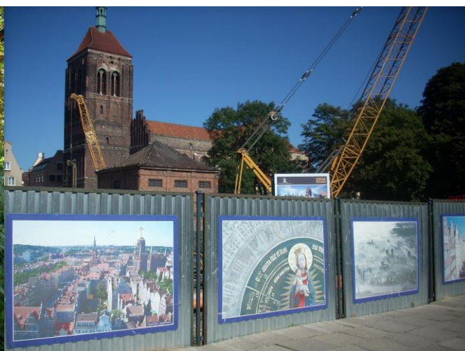
Fot 6. Ogrodzenie placu budowy na obszarze Głównego Miasta przy ul. Szerokiej w Gdańsku. W tle Kościół św. Jana.