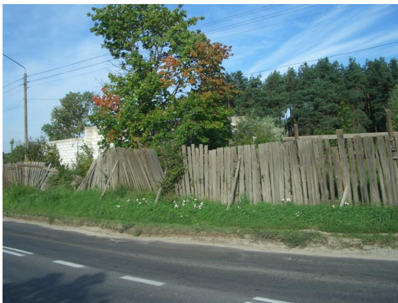
Fot 1. Ogrodzenie terenu porzuconej budowy od 10 lat przy ulicy Świętokrzyskiej w dzielnicy Gdańsk - Łostowice.

Dla subiektywnej oceny estetyki ogrodzenia nie bez znaczenie pozostaje rodzaj struktury, która może być pełna lub ażurowa. Ażurowe ogrodzenie umożliwia wydzielenie miejsca z przestrzeni, zabezpieczenie placu budowy i jednocześnie dzięki transparentności zapewnia obserwatorowi poczucie ciągłości przestrzeni (Fot.3.). Dodatkowo pozwala użytkownikom przestrzeni zaspokoić naturalną ciekawość i obserwować przebieg prac toczących się za płotem. Należy pamiętać, że pełna przegroda wprowadzając fizyczną oraz wizualną barierę może wywoływać negatywne emocje związane z utratą wolnej przestrzeni. Jednak o wyborze pełnej struktury ogrodzenia przesądzić mogą względy bezpieczeństwa (ochrona przed pyłem, światłem, niebezpiecznymi elementami przyległymi do ogrodzenia). W takim przypadku są również dostępne rozwiązania uwzględniające ludzką naturę, pozwalające na „legalny” wgląd na teren budowy w postaci: wizjerów, okienek lub ażurowych fragmentów ogrodzenia (Fot.4.).