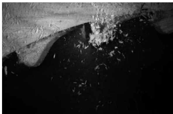
Powstawanie wiórów podczas przecinania sosny suchej i zmrożonej piłą tarczową (po lewej – drewno suche, po prawej – drewno zmrożone).

– We współczesnym przerobie drewna przepływ surowca powinien być „inteligentny”, począwszy od jego pozyskania w lesie – mówił fiński naukowiec. – To oznacza, że powinno się zastosować nowe podejście, w którym zawarte byłyby informacje o jakości surowca, jego źródle pochodzenia, a także właściwościach wytrzymałościowych materiału drzewnego, mogące wspomagać współdziałanie pomiędzy producentem a zorientowanym odbiorcą. Znaczący wpływ na wydajność materiałową ma stosowany system podziału dłużyć na kłody, który powinien uwzględniać głównie jakość surowca. Ta może być dokładnie poznana nie tylko na podstawie