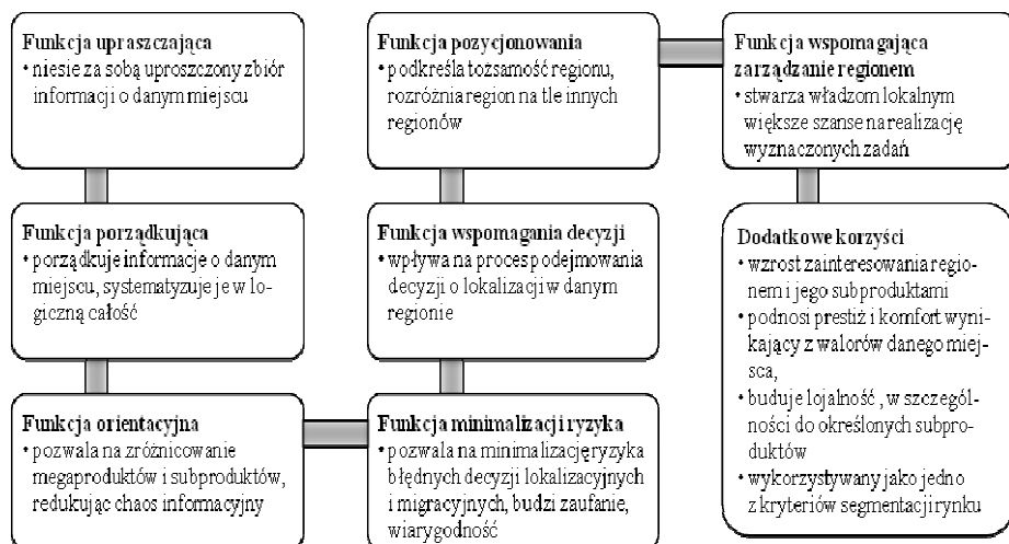
Rys. 1. Funkcje wizerunku regionu

duktów pozwalają na uzyskanie dodatkowej korzyści 15 , jak i poszczególnych subproduktów (np. turystycznego, inwestycyjnego, mieszkaniowego, socjalnego, oświatowo-kulturalnego).