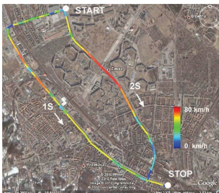
Rys. 4. Średnia prędkość jazdy na trasach: 1S i 2S