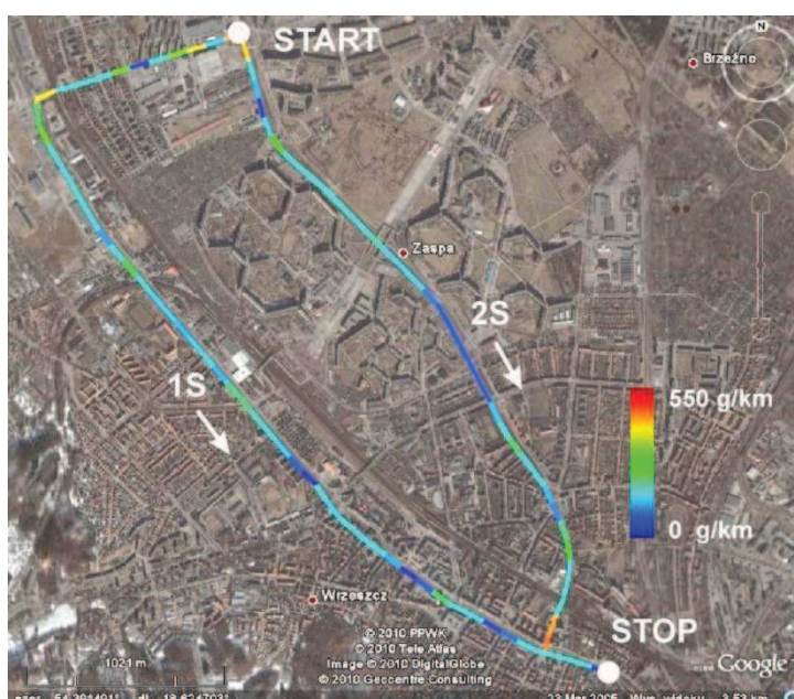
Rys. 5. Emisja CO 2 na trasach: 1S i 2S