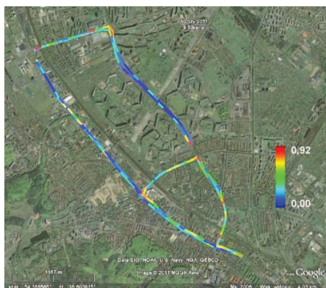
Rys. 3. Mapa warunków eksploatacji – udział czasu pracy silnika na biegu jałowym w stosunku do całkowitego czasu jazdy ( t_{bj}/t_c )