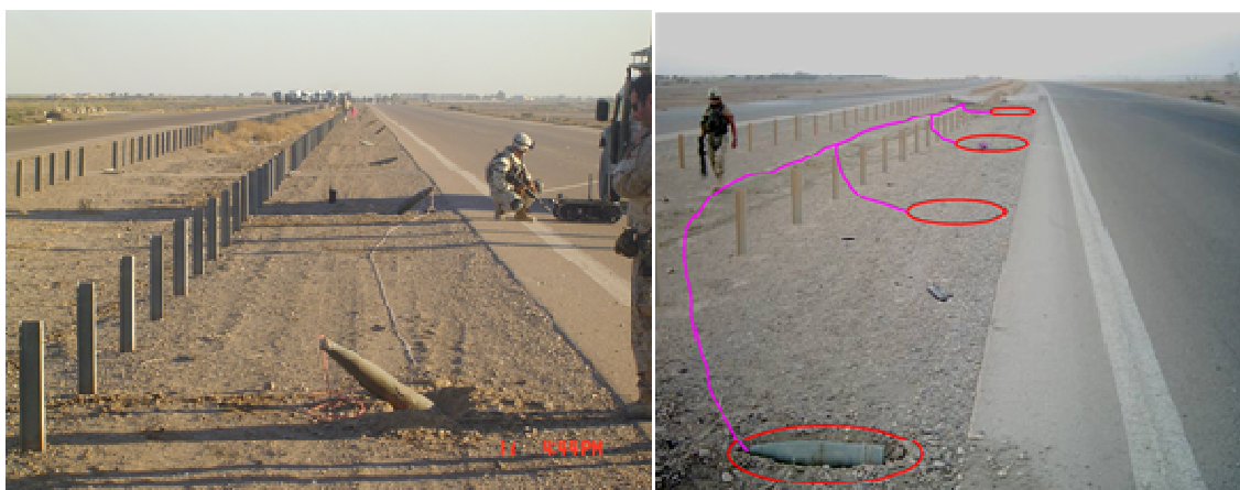
Rys. 5. Zespół EOD podczas neutralizacji IED zbudowanego na bazie pocisków artyleryjskich

Kolejnym filarem opisywanej strategii jest koncepcja zwalczania już podłożonych lub zmontowanych i gotowych do detonacji urządzeń IED. Przy czym zakłada się możliwość ich wykrycia przy pomocy środków technicznych, opracowanych procedur postępowania, czy też tylko dzięki obserwacji przedpola i nietypowych zachowań ludzkich. Pozwoli to siłom sojuszniczym na uniknięcie bezpośredniego kontaktu z IED i wezwanie specjalistycznych oddziałów, tj.: EOD ( Explosive Ordnance Disposal ) lub IEDD ( IED Disposal ), przeznaczonych do niszczenia prowizorycznych urządzeń wybuchowych. Na rysunku 5 widoczny jest oddział EOD podczas neutralizacji IED zbudowanego na bazie pocisków artyleryjskich.