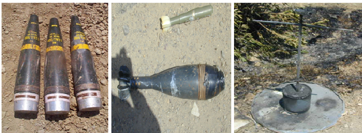
Rys. 1. Prowizoryczne urządzenia wybuchowe wykonane na bazie uzbrojenia wojskowego (pociski artyleryjskie, pociski moździerzowe, miny)

Jest to zatem urządzenie stosunkowo tanie i proste w produkcji, pozwalające ich operatorom na uniknięcie kontaktu bezpośrednio z jego silniejszym przeciwnikiem. Ponadto IED jest bronią efektywną, zbudowaną ze składników zarówno pochodzenia wojskowego (rys. 1), jak również cywilnego (rys. 2), ograniczającą możliwości manewrowe wojsk na poziomie taktycznym.