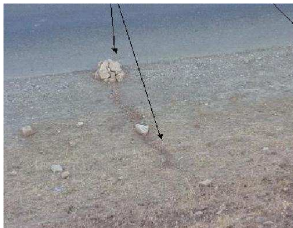
Rys. 6. Niedokładne zamaskowanie magistrali elektrycznej i ukrycie IED pod charakterystyczną kupką kamieni przy drodze

precyzyjniejsze wykrywanie, neutralizację i minimalizowanie efektów oddziaływania tego typu broni.