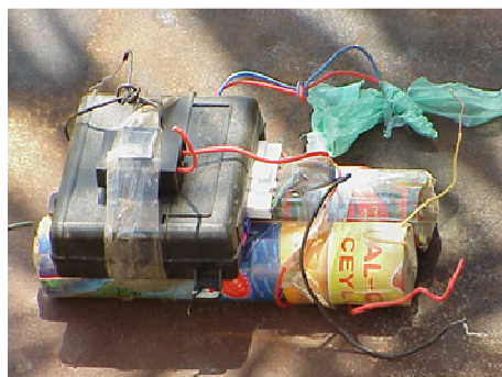
Rys. 2. Prowizoryczne urządzenia wybuchowe wykonane na bazie materiałów ogólnodostępnych