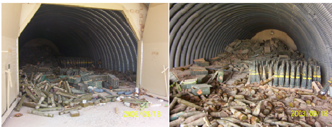
Rys. 4. Zlikwidowany skład pocisków artyleryjskich, wykorzystywanych w IED

Filar pierwszy, czyli zwalczanie systemu IED jako całości, zakłada ograniczenie zaopatrzenia niezbędnego do wykonania prowizorycznych urządzeń wybuchowych, między innymi poprzez likwidowanie składów pocisków artyleryjskich (rys. 4). Zakłada on również odcięcie systemu IED od źródeł finansowania, typowanie i eliminowanie osób zajmujących kierownicze stanowiska w systemie, a także zmniejszenie liczby rekrutów chętnych do bycia tzw. nosicielami IED.