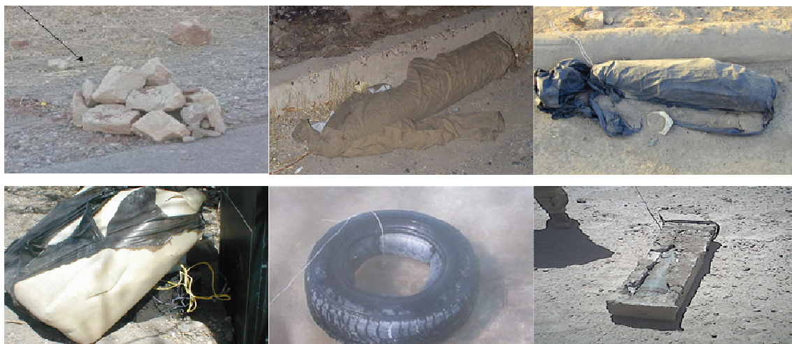
Rys. 3. Przykłady maskowania urządzeń IED

Urządzenia IED zazwyczaj są maskowane w celu utrudnienia ich identyfikacji. Przykładowe sposoby ukrywania pułapek wykorzystujących ten rodzaj broni przedstawiono na rysunku 3. Mogą do tego celu być wykorzystywane kamienie, płaszcze, folia, butelki, opony, a nawet spotkać można IED zalane betonem.