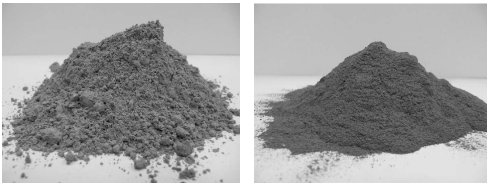
Rys. 1. Widok ogólny popiołu powstałego ze spalania węgla kamiennego a) bez biomasy b) z udziałem biomasy