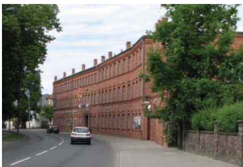
Fot. 2. Dawna Fabryka Wyróbów Metalowych Emila Kelcha, obecnie Centrum Wystawienniczo-Regionalnego Dolnej Wisły „Fabryka Sztuk”

stracili miejsca pracy, znalazło lub samodzielnie zorganizowało sobie zatrudnienie w usługach i drobnym handlu. Działalność ta była jednak lokowana przede wszystkim w zachodniej części miasta oddzielonej od Starego Miasta magistralą kolejową. Na utratę dotychczasowej roli historycznego centrum miała również wpływ lokalizacja wielkich obiektów handlowych na obrzeżach miasta. Malowniczo położone na skarpie nadwiślańskiej historyczne centrum miasta uległo marginalizacji, której towarzyszyły patologie społeczne oraz zły stan techniczny przestrzeni publicznych wraz z otaczającą je historyczną zabudową [Lokalny Program Rewitalizacji... 2009].