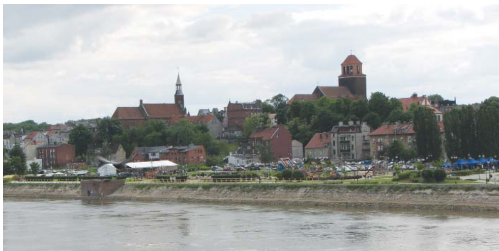
Fot. 3. Panorama Starego Miasta w Tczewie z Bulwarem Nadwiślańskim na pierwszym planie

W połowie lat 90. lokalne władze podjęły działania na rzecz podniesienia atrakcyjności centrum, a zarazem przesunięcia ciężenia układu funkcjonalnego miasta w stronę Wisły. Celem pierwszych prac była poprawa stanu technicznego i podniesienie bezpieczeństwa przestrzeni publicznych – przede wszystkim ulic [Gołędzinowska 2010].