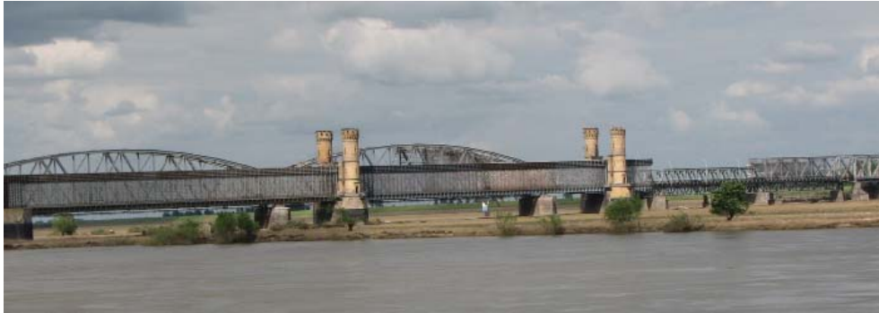
Fot. 1. Most kolejowy i drogowy w Tczewie