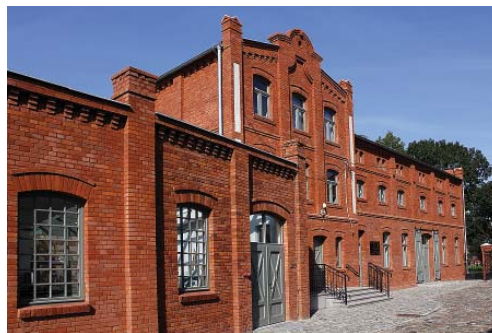
Fot. 7. Dawna mleczarnia, obecnie Żuławski Park Historyczny