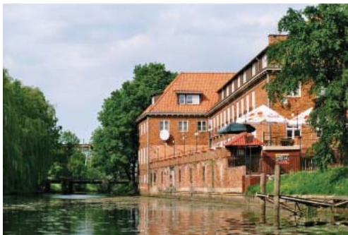
Fot. 6. Gmach starostwa w Nowym Dworze Gdańskim z mostem zwodzonym w tle Źródło: petla-zulawska.pl (Piotr Salecki).

Celem nowego wizerunku miasta jest przede wszystkim wzmocnienie roli stolicy powiatu zgodnej z założeniami reformy terytorialnej – tj. centrum, z którym utożsamiają się mieszkańcy miasta i okolicznych gmin. Wobec skali i wyrazistości wizerunkowej pobliskich miast – Malborka i Elbląga – wykorzystano niszę wynikającą z braku wyrazistego ośrodka kultuwującego i promującego dziedzictwo Żuław Wiślanych. Dzięki działalności „Klubu Nowodworskiego” i powołaniu Żuławskiego Parku Historycznego udało się wytworzyć nową narrację miejsca – adresowaną przede wszystkim do społeczności lokalnej, jednocześnie stanowiącą ważne uzupełnienie produktów turystycznych dotyczących obszaru Deltę Wisły (np. „Pętla Żu-