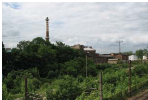
Fot. 5. Wyłączona z produkcji cukrownia w Pruszczu Gdańskim