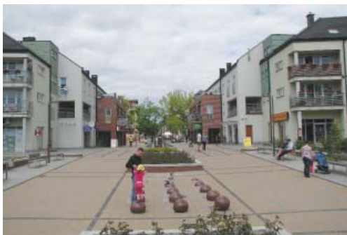
Fot. 4. Aleja ks. Wałęga – nowe centrum Pruszcza Gdańskiego

Nowym projektem realizowanym w Pruszczu Gdańskim, którego sama formuła niesie ze sobą silny wątek wizerunkowy, jest projekt stworzenia społecznej koncepcji zagospodarowania przestrzennego terenów dawnej cukrowni „Strefa Cukru”. Przedmiotem projektu jest obszar o powierzchni 20 ha wraz z zabytkowymi zabudowaniami cukrowni (fot. 5). Zespół położony w centralnej części miasta został wyłączony z produkcji w 2004 r. [www.strefacukru.pl 2012]. Początkowo władze miasta zakładały adaptację zespołu na funkcje usługowe, jednak w miarę trudności z pozyskaniem inwestora zdecydowano się na zmianę przeznaczenia terenu na obszary mieszkaniowe, co jednak również nie przyniosło oczekiwanych rezultatów. Miasto nie jest właścicielem terenu co z założenia ogranicza możliwość lokalizacji usług