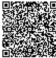
Rys. 3. Wizytówka autorki – kod QR

Za pomocą QR kodu można zapisać m. in. adres URL witryny, jakiegokolwiek tekst, numer telefonu, adres e-mail, vCard (wizytówka zawierająca imię, nazwisko oraz dane kontaktowe – rys. 3), SMS (numer telefonu, wiadomość), notatkę dotyczącą wydarzenia (nazwa, data oraz czas trwania, opis), współrzędne geolokalizacji (m.in. restauracji, hoteli), wifi network (SSID, hasło, typ sieci).