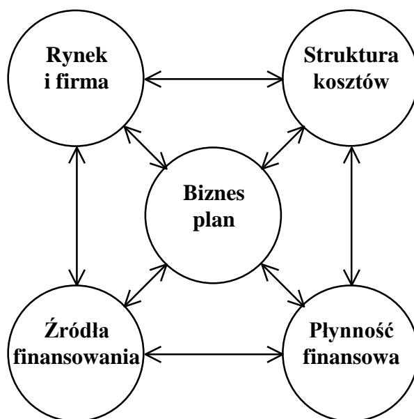
Rys. 2. Moduły webinarium „Biznes plan”

Schemat realizacji przeprowadzonego webinarium „Biznes plan” składał się z kilku etapów, które zostały omówione w dalszej części rozdziału.