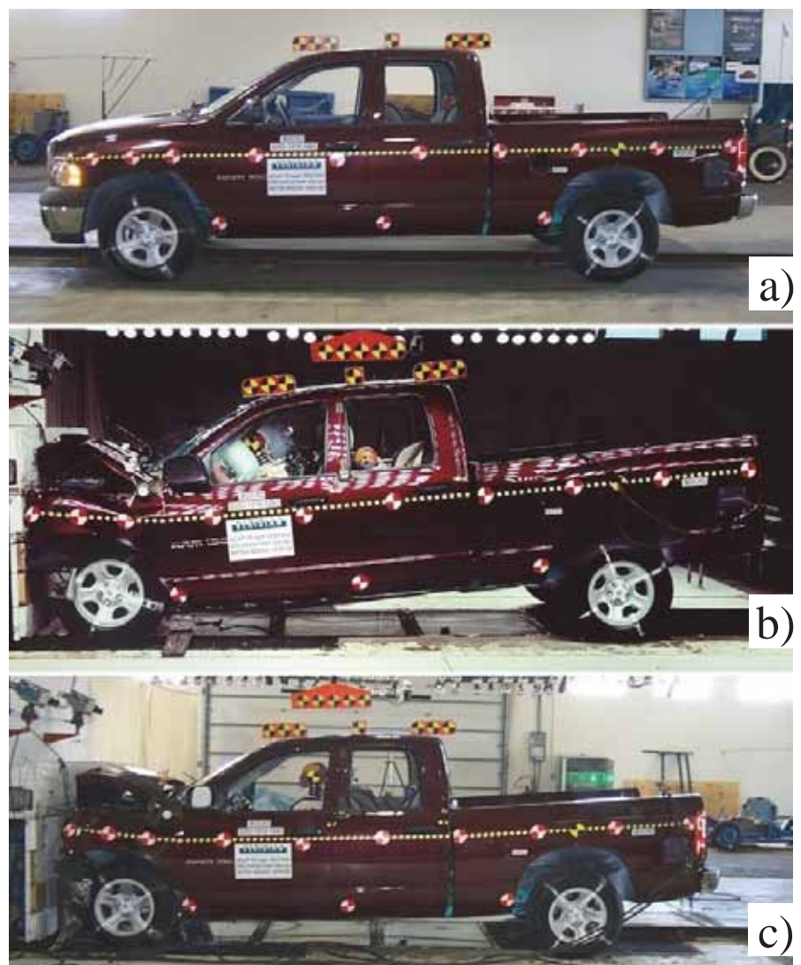
Fot. 3. Samochód: a) przed zderzeniem, b) w trakcie zderzenia, c) po zderzeniu [1]

Dla manekina siedzącego przodem do kierunku jazdy największa wartość opóźnienia wzdłużnego głowy występuje przy 0,08 s ze szczytową wartością przyspieszenia wynoszącą około -56 g (rys. 1, b). Pomiedzy 0,11 s a 0,14 s wartość opóźnienia oscyluje wokół wartości około -15 g. Spowodowane jest to wyhamowującym oddziaływaniem pasów. Drugi pik w czasie 0,21 s wynika z uderzenia głowy dziecka o sztywne oparcie fotelika samochodowego. Ma on wartość 23 g, która jest mniejszą od wartości dopuszczalnej. Część energii kinetycznej manekina została już pochłonięta przez pasy