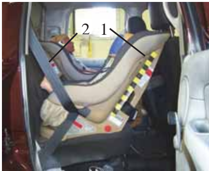
Fot. 2. Foteliki zamocowane w samochodzie, 1- przodem do kierunku jazdy, 2 – tyłem do kierunku jazdy [1]

ramie wzdłużnej, do której zamocowane jest nadwozie. Masa własna pojazdu wynosiła 2236 kg. Masa pojazdu przygotowanego do badania to 2524 kg. Na tylnym siedzeniu w dwóch identycznych fotelikach (Fot. 2) zostały umieszczone dwa manekiny. Jeden z nich odpowiadający wielkością trzyletniemu dziecku został zamocowany przodem do kierunku jazdy, a drugi manekin wielkości niemowlęcia tyłem do kierunku jazdy. Wykorzystany w teście fotelik pozwala na przewóz dzieci z grupy 0 i I. Dzieci poniżej 10 kg muszą podróżować tyłem do kierunku jazdy. Większe dzieci natomiast mogą podróżować przodem do kierunku jazdy (Fot. 2). W obu przypadkach fotelik mocowany jest trzypunktowym pasem samochodowym oraz dodatkowym pasem zapinanym do zaczepu za tylnym siedzeniem samochodu.