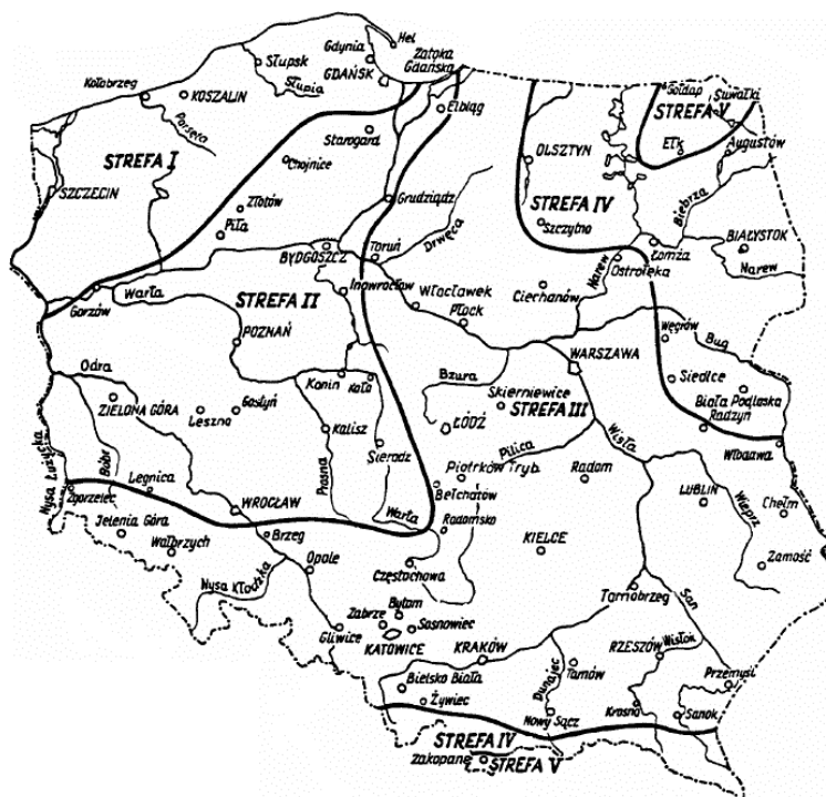
Rysunek 1. Mapa klimatyczna Polski ze wskazaniem na poszczególne strefy Figure 1. Climatic map of Poland with indication of particular zones