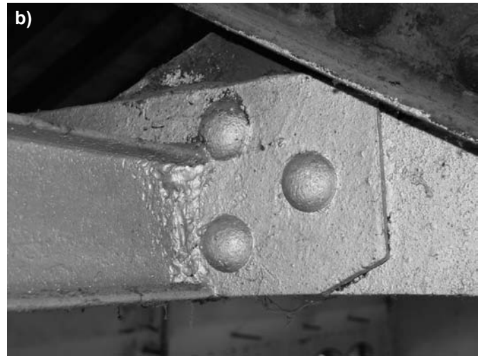
Rys. 3. Węzły konstrukcyjne stalowych więzów kratowych w miejscu połączenia prętów dodatkowych oraz istniejącej konstrukcji a) połączenie krzyżulców wewnętrznych środkowych z pasem dolnym – A, b) w miejscu połączenia konstrukcji nośnej sufitu podwieszanego – połączenie I 80 mm w miejscu krzyżowania się krzyżulca zewnętrznego, wewnętrznego oraz słupka wewnętrznego – B

PN-80/B-02010 ( Q_k = 0,7 \text{ kN/m}^2 , \gamma_f = 1,4 ) i starej normy wiatrowej PN-77/B-02011 ( q_k = 0,35 \text{ kN/m}^2 , \gamma_f = 1,3 ) oraz zaktualizowanych norm: tzw. nowej normy śniegowej PN-80/B-02010:Az1:2006 ( Q_k = 1,2 \text{ kN/m}^2 , \gamma_f = 1,5 ) i nowej normy wiatrowej PN-77/B-02011:Az1:2009 ( q_k = 0,42 \text{ kN/m}^2 , \gamma_f = 1,5 );