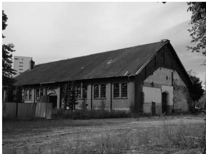
Rys. 1. Budynek Wozowni – stan istniejący

( f_m = 1,0 \div 2,0 MPa). Przekrycie budynku stanowią stalowe wiązary kratowe o rozpiętości równej szerokości budynku, które są rozmieszczone w rozstawie \approx 600 cm. W kierunku podłużnym na wiązarach ułożono płatwie drewniane o wymiarach w przekroju poprzecznym 23 \times 26 cm. Na płatwiach natomiast ułożono krokwie drewniane o wymiarach w przekroju poprzecznym 13 \times 16 cm i średnim rozstawie c_o \approx 120 cm. Na krokwiach wykonano pełne deskowanie z desek drewnianych o grubości 2,2 cm.