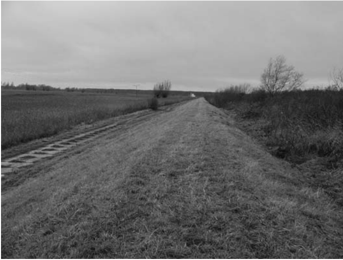
Rys. 1. Widok nasypu na polderze 76 w miejscowości Nowe Dolno zmodernizowanego z zastosowaniem metody zagęszczania udarowego po 13 latach eksploatacji budowli

W drugim etapie, po rozbudowaniu i podwyższeniu nasypu wybito kinetę w nadbudowanej części metodą udarową, wykonując rdzeń szczelny, którego oś pokrywała się z osią rdzenia w starym nasypie.