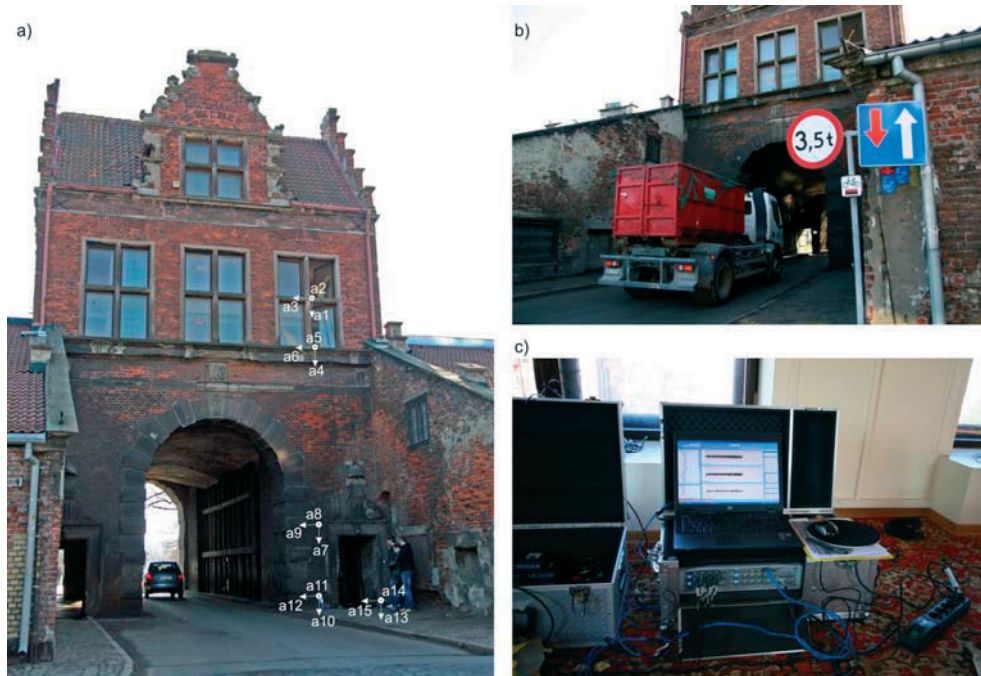
Rys. 7. Brama Nizinna: a) rozmieszczenie punktów pomiarowych na elewacji północnej; b) wymuszenie dynamiczne; c) sprzęt pomiarowy