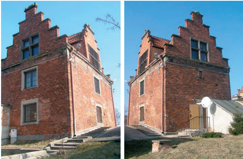
Rys. 4. Wartownia z widocznymi rurami spustowymi oraz fragment korony wału nad przejazdem

Brak prawidłowych rozwiązań odprowadzania wody oraz zła izolacja przeciwwilgociowa połączone z ciągłym ruchem samochodów przez Bramę, bardzo rzadkim sprzątnięciem i czyszczeniem Bramy oraz jej okolic sprawiają, że fragmenty muru w rejonie przejazdu są w bardzo złym stanie. Na całej powierzchni kolebki oraz ścianach bocznych przejazdu widoczne są wykwity wapienne. Na ścianach przejazdu ubytki cegły mają średnią głębokość około 4 cm i obejmują około 40% powierzchni ścian. Na rysunku 2b widoczny jest ubytek ściany przejazdu głębokości około 12 cm. Zachodnia ściana przejazdu łuszczy się i jak widać na rysunku 2c ze ściany odpadają kolejne płyty cegieł, a głębsze strefy cegieł są również mocno zdegradowane. Ściany przejazdu pokryte są grubą warstwą pyłów i brudu, co sprzyja utrzymywaniu wilgoci w murze i pogarsza stan konstrukcji.