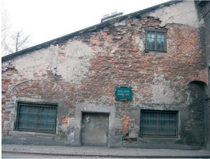
Rys. 5. Wschodnia dobudówka Bramy Nizinnej