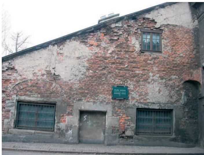
Rys. 5. Wschodnia dobudówka Bramy Nizinnej