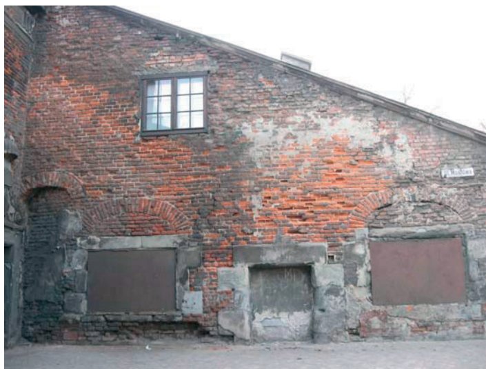
Rys. 6. Zachodnia dobudówka Bramy Nizinnej

Ubytki na ścianach dwóch symetrycznych dobudówek (rys. 5 i 6) sięgają 12 cm głębokości, ich średnia głębokość wynosi około 6 cm, obejmują one około 65% powierzchni tych dobudówek. W czasie wcześniejszych napraw uzupełniano ubytki zaprawą cementową jednak bez usunięcia przyczyn postawania ubytków. Na ścianach tych widoczne są także rysy.