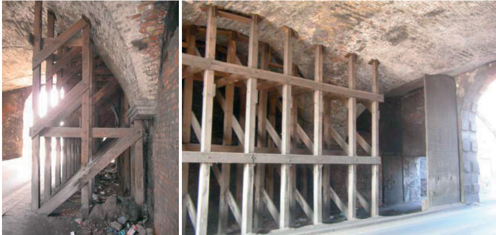
Rys. 3. Przejazd Bramy Nizinej z widoczną drewnianą kratownicą