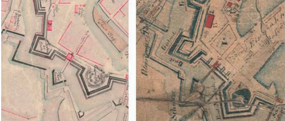
Rys. 1. Rejon Bramy Nizinnej w roku 1835 [4] oraz po roku 1860 [5]

przejściami dla pieszych. Z pośród tych trzech bram, Brama Nizinna została wykonana z największym rozmachem ukazującym bogactwo i siłę Gdańska. Szczególnie uznanie budzą wykończenie i detale obu fasad – południowej, wychodzącej na zewnątrz miasta i północnej – wewnątrzmięskiej.