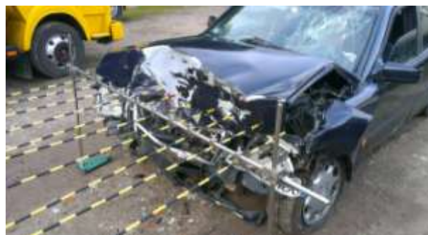
Rys. 3. Uszkodzenia pojazdu (lewa strona nadwozia)

Dane zebrane w tabeli 1 można przedstawić, jako profil odkształcenia czoła pojazdu (rys. 4).