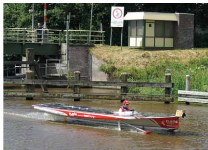
Clafis – najwspanialsza jednostka z klasy open, ultralekki wodolot z napędem contr-rotation , czyli dwiema śrubami obracającymi się w przeciwnym kierunku

Łodzie biorące udział w regatach rywalizują ze sobą w kilku klasach. Najbardziej ekskluzywna to „Top klasa” – łodzie o długości do ośmiu metrów z jednym członkiem załogi, które mogą być wyposażone w lekkie, cienkie panele fotowoltaiczne o maksymalnej mocy szczytowej nieprzekraczającej 2,5 kW. Ekipy startujące w tej klasie zalicza się do „zamożnych” uczestników, bowiem koszt łodzi zazwyczaj przekracza sto tysięcy euro.