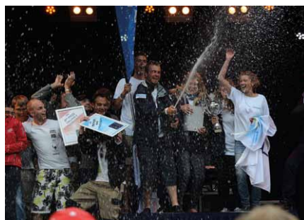
Zespół z Wydziału Oceanotechniki i Okrętownictwa Politechniki Gdańskiej na podium świętuje zwycięstwo w klasie łodzi dwuosobowych

grał dosłownie o włos! Było ciężko, ale takie zwycięstwo inaczej smakuje. Konkurenci byli bardzo dobrzy.