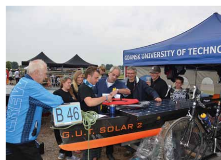
Komisja sędziowska kontroluje wyposażenie ratunkowe łodzi solarnej z Wydziału Oceanotechniki i Okrętownictwa Politechniki Gdańskiej

Dwie najbardziej popularne klasy, w których startują ekipy z Polski, to sześciometrowe jednostki z jednym sternikiem ( Scigrip Solar Boat Team – Bar-