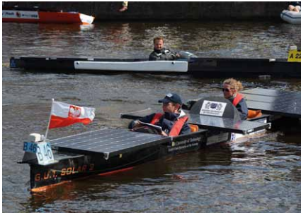
Nasza łódź – zawsze łatwa do rozpoznania nawet z daleka dzięki banderze na dziobie

kowym źródłem energii o mocy szczytowej 1000 Wp w klasie łodzi jedno- i 1250 Wp w klasie dwuosobowych.