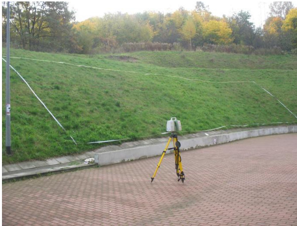
Rys.1. Obiekt pomiaru