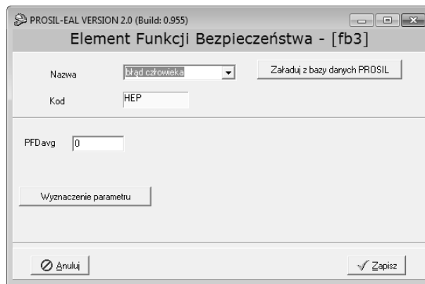
Rys.3. Element funkcji bezpieczeństwa – błąd człowieka

Na rysunku 3 przedstawiono edytor graficzny pojedynczego elementu funkcji bezpieczeństwa, jakim jest HEP. W tym wypadku można zauważyć wartość PFD_{avg} , która oznacza prawdopodobieństwo niewypełnienia funkcji na przywołanie.