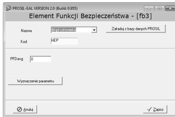
Rys.3. Element funkcji bezpieczeństwa – błąd człowieka

Na rysunku 3 przedstawiono edytor graficzny pojedynczego elementu funkcji bezpieczeństwa, jakim jest HEP. W tym wypadku można zauważyć wartość PFD_{avg} , która oznacza prawdopodobieństwo niewypełnienia funkcji na przywołanie.