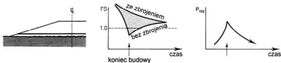
Rys. 2. Nasyp na słabym podłożu gruntowym ze zbrojeniem w podstawie [5]