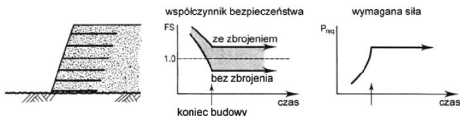
Rys. 1. Zbrojone strome skarpy i konstrukcje oporowe [5]

W przypadku posadawiania nasypów na słabym podłożu gruntowym, konieczność wbudowania w podstawę nasypu zbrojenia geosyntetycznego wynika głównie z potrzeby wzmocnienia podłoża w okresie jego konsolidacji. Po jej zakończeniu rola geosyntetyku jest niewielka, a współczynniki bezpieczeństwa są podobne jak w przypadku, gdyby geosyntetyku nie było (rys. 2). Rozważając wymaganą wartość wytrzymałości na rozciąganie geosyntetyku należy zwrócić uwagę, że w wartości tej trzeba uwzględnić parametry słabego podłoża gruntowego oraz wpływ konsolidacji.