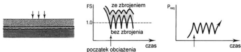
Rys. 3. Stabilizacja podłoża (obciążenia zmienne) [5]

W celu prawidłowego spełniania funkcji zbrojenia w podstawie nasypu, geosyntetyk powinien charakteryzować się, podobnie jak w przypadku zbrojenia skarp i konstrukcji oporowych, odpowiednią wytrzymałością na rozciąganie i trwałością. Analizując odporność chemiczną, należy uwzględnić właściwości materiałów, z którymi zbrojenie geosyntetyczne będzie w kontakcie, w szczególności odczyn pH. Jeżeli wartość pH gruntu wykracza poza przedział od 4 do 9 (dochodzi do tego np. przy stabilizacji podłoża spoiwem hydraulicznym), należy ten fakt uwzględnić, dobierając wyrób z odpowiedniego polimeru.