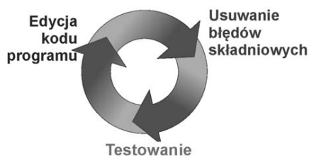
Rysunek 1. Cykl tworzenia kodu programu

Ponieważ podczas tworzenia oprogramowania błędy w praktyce inżynierskiej są praktycznie nieuniknione, również studenci muszą opanować pracę w zwykłym programistycznym cyklu obejmującym: edycję kodu, usuwanie błędów składniowych oraz uruchamianie i testowanie programu w celu znalezienia błędów wykonania i błędów logicznych (rys.1). Tę pracę wspomagają narzędzia programistyczne, w zestawach zwanych IDE ( Integrated Development Environment , zintegrowane środowisko programistyczne). Błędy składniowe wykrywane są przez kompilator lub linker. Błędy wykonania wykrywane są przez środowisko uruchomieniowe ( runtime ). Na wstępnych kursach programowania nie uczy się na ogół wykorzystania debuggera.