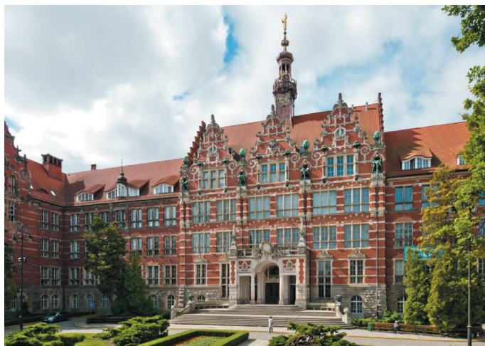
Rys. 5. Obecny widok Gmachu Głównego

W ciągu 111 lat istnienia Politechnika Gdańska przez 41 lat była uczelnią pod wpływami niemieckimi natomiast kolejne lata to szkoła polska. W tym okresie nastąpił znaczący jej rozwój (tabl. 1). Kubatura budynków wzrosła czterokrotnie, na obszarze o powierzchni 60 hektarów znajduje się ponad 80 budynków z 116 tysiącami m 2 powierzchni dydaktyczno-badawczej, 160 sal wykładowo-seminaryjnych, w tym 20 audytoriów, około 200 laboratoriów dydaktycznych i 65 laboratoriów komputerowych, gdzie jest około 1500 stanowisk komputerowych dostępnych do Internetu przeznaczonych dla studentów. Wzrosła liczba zasoby biblioteki PG, liczba woluminów wzrosła czterdziestokrotnie. 45 razy wzrosła liczba studentów: z 600 w roku 1904 do 27 000 w 2014. Wzrosła także 15-krotnie liczba pracowników naukowych i dydaktycznych.