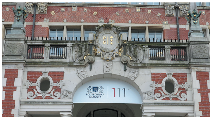
Rys. 1. Logo jubileuszu widoczne nad wejściem do gmachu głównego Politechniki Gdańskiej.

Politechnika Gdańska obchodzi w tym roku niezwyklej jubileusz 111 lat istnienia (rys. 1). 6 października 1904 roku odbyła się pierwsza inauguracja roku akademickiego w nowo otwartej Królewsko-Pruskiej Wyższej Szkole Technicznej w Gdańsku (Königliche Preussische Technische Hochschule) [1], której zadaniem było kształcenie techniczne na poziomie akademickim na obszarze Pomorza. Pierwszym rektorem politechniki w Gdańsku został wybitny matematyk Hans von Mangoldt (1904–1907). W ponad wiekowym istnieniu uczelni wyróżnić można kilka charakterystycznych okresów związanych z historycznymi losami Gdańska, a mianowicie okres pruski (1904–1920), Wolnego Miasta (1920–1945), okres PRL (1945–1989) i okres RP (po roku 1989) [1].