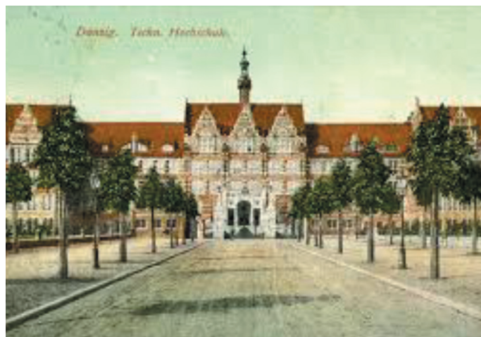
Rys. 2. Politechnika w Gdańsku tuż po jej otwarciu, pocztówka.

W okresie Wolnego Miasta Gdańska zmieniono nazwę uczelni na Wyższą Szkołę Techniczną Wolnego Miasta Gdańska (Technische Hochschule der Freien Stadt Danzig). 1 sierpnia 1922 roku wprowadzono zmiany w statucie,