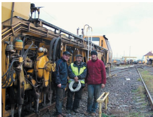
Rys. 6. Transport kolejowy: z lewej laboratorium kolejnictwa na dziedzińcu północnym gmachu głównego, z prawej stanowisko pomiarowe w Maksymilianowie.

i Wydziału Budowy Okrętów powołanego w 1945 roku, a w 1968 roku zmienionego w Instytut Okrętowy. W 1990 roku Instytut Okrętowy przekształcił się w obecny Wydział Oceanotechniki i Okrętownictwa. To przekształcenie oznacza modyfikację profilu kształcenia, jego zakresu i metod w konsekwencji zmian w zasięgu i sposobach eksploatacji mórz i oceanów. Zmiany w gospodarce narodowej i na rynku pracy spowodowały, że obok kierunku studiów Oceanotechnika na Wydziale prowadzi się obecnie także studia I stopnia na kierunku Transport.