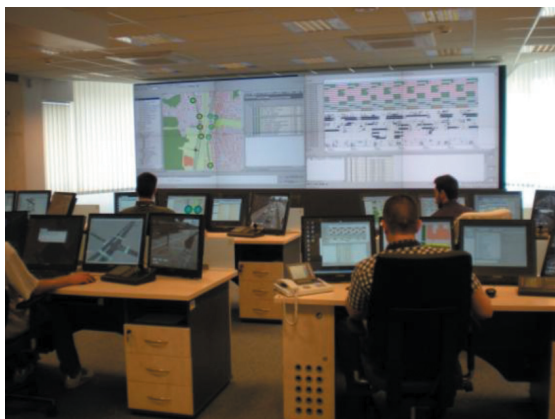
Rys. 7. Ilustracja prac katedry Inżynierii Drogowej: z lewej laboratorium badań drogowych, z prawej centrum sterowania ruchem w systemie TRISTAR w Gdyni.