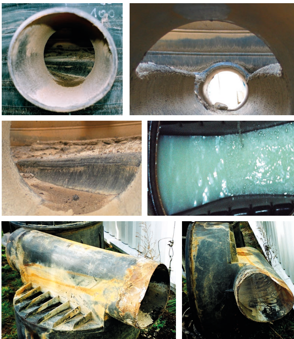
Rys. 2. Przykłady uszkodzeń i zniszczeń w wyniku nieodpowiedniego posadowienia obiektów kanalizacyjnych na przykładzie studzienek rewizyjnych