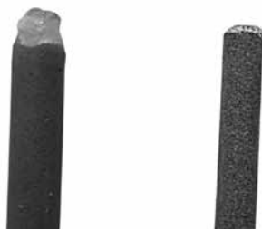
Rys. 1. Widok elektrod otulonych: a) elektroda do spawania pod wodą z powłoką wodoodporną; b) standardowa elektroda rutyłowa Fig. 1. View of coated electrodes: a) waterproofed electrode for underwater welding; b) standard rutile electrode

łatwego zajarzenia łuku i zachowaniu stabilności procesu. Na rysunku 1 pokazano rutyłowe elektrody o średnicy 4 mm do spawania pod wodą i na powietrzu.