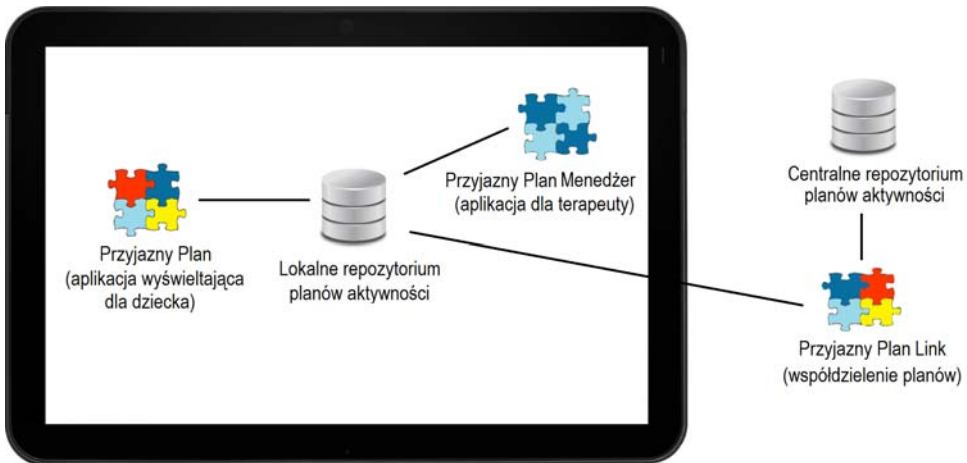
Rysunek 1. Rodzina aplikacji wspomagających terapię behawioralną dzieci autystycznych metodą planów aktywności