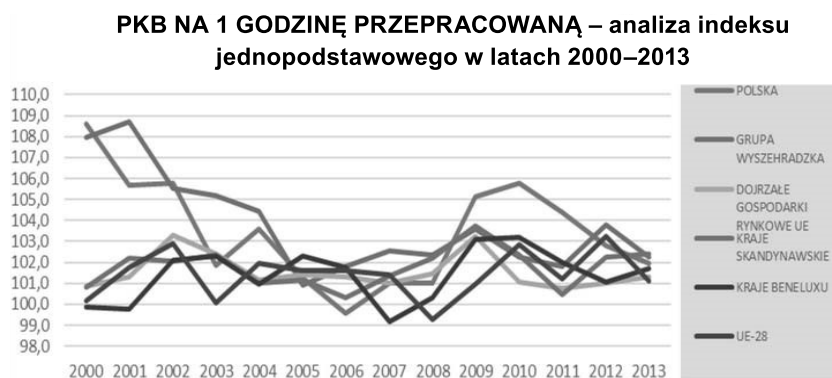
Wykres 2. PKB na 1 godzinę pracy – analiza indeksu łańcuchowego Polski na tle wybranych grup krajów Unii Europejskiej w latach 2000–2013

Następnie zbadano wydajność pracy w Polsce i we wszystkich wcześniej wytypowanych grupach krajów, mierząc wartości indeksu łańcuchowego. Wyniki tak przeprowadzonych badań zilustrowano na wykresie 2.