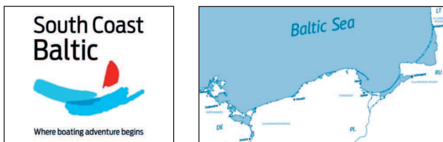
Rys. 1. Logo marki South Coast Baltic i obszar produktu South Coast Baltic