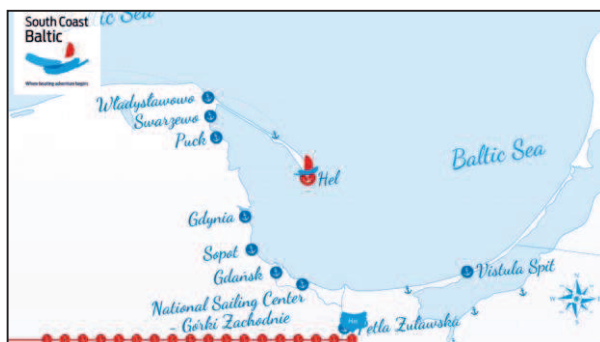
Rys. 3. Wirtualny rejs jachtem wzdłuż południowego brzegu Bałtyku