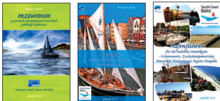
Rys. 5. Różne okładki przewodnika z wykorzystaniem marki South Coast Baltic