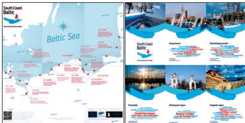
Rys. 2. Folder promocyjny South Coast Baltic

Folder promocyjny, składany do formatu kieszonkowego, jest podstawowym materiałem promującym markę South Coast Baltic 23 . Wewnętrzna strona folderu przedstawia propozycje siedemnastodniowego rejsu z Nidy (LT) do Lautrebach (DE), natomiast na okładce opisano pięć regionów południowego Bałtyku, podając dla każdego z nich charakterystyczne wyróżniki (rys. 2).