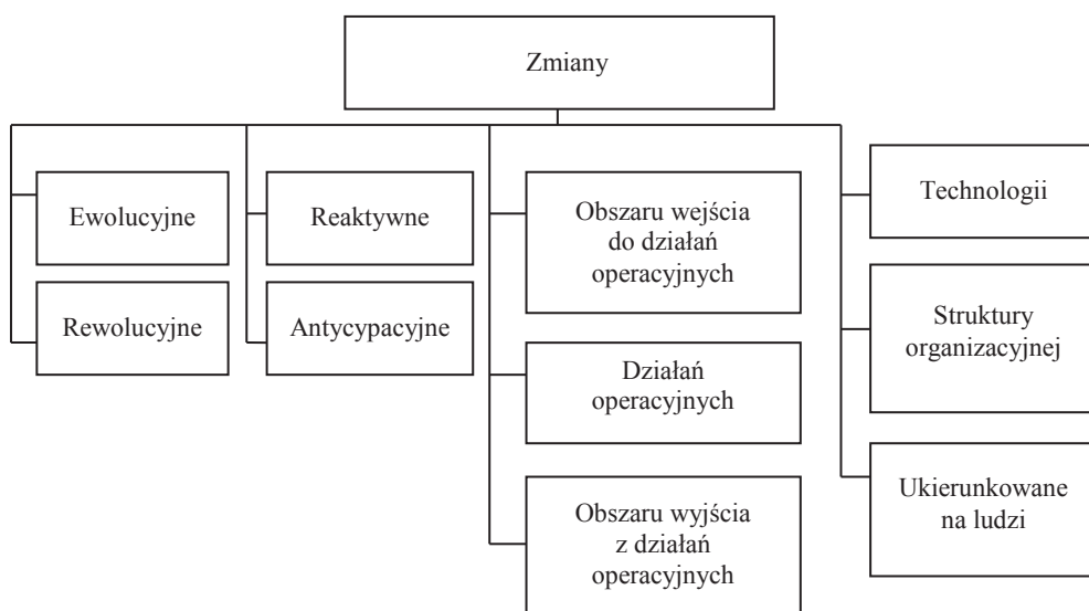
Rys. 1. Wybrane podziały zmian

wanie prób jej doskonalenia. Powinno ono wpisywać się w ustawiczne działania zarówno samego podmiotu leczniczego, jak i ustawodawstwa związanego z tym sektorem. Ciągłe działania związane ze zmianami doskonalącymi powinny na stałe wpisywać się w funkcjonowanie podmiotów, co wynika także z pojęcia zmiany związanej z „nowym stanem o potencjalnie zwiększonym ładzie i zorganizowaniu” [Grzybowska 2010, s. 10]. Należy jednak pamiętać, że zmiana nie zawsze musi dać pozytywny efekt, ale może zaburzyć dotychczasowy stan systemu i zmniejszyć jego efektywność [Jasiński 2005b, s. 28]. Zmiany w organizacji mogą mieć bardzo różnicowany charakter, a ich wybrane klasyfikacje zaprezentowano na rysunku 1.