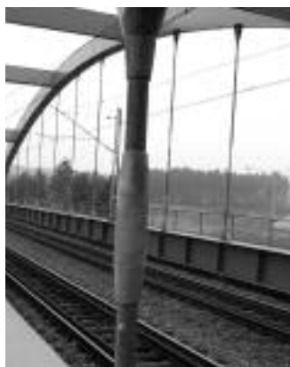
Fot. 1. Wieszak z łącznikiem umożliwiającym napięcie

Jednym z istotnych problemów podczas budowy obiektów łukowych jest zapewnienie odpowiednich sił w wieszakach. W Polsce powszechnie stosuje się systemy podwieszenia prętowego z możliwością regulacji naciągu (fotografia 1), w których korekty siły naciągu w wieszaku dokonuje się za pomocą łącznika napinającego na dowolnym etapie budowy. Skrajnie inne podejście stosowane jest w przypadku systemów popularnych na rynku niemieckim. Metoda polega na przyspawaniu prętów przez blachy węzłowe do łuku i pomostu (fotografia 2). Jest to rozwiązanie tańsze, ale wymaga instalacji cięgien, gdy przęsło jest podparte. Siły w cięgnach powstają w sposób naturalny po zwolnieniu przęsła z podpór tymczasowych. Metoda wymaga precyzyjnych obliczeń i montażu, ponieważ nie pozwala