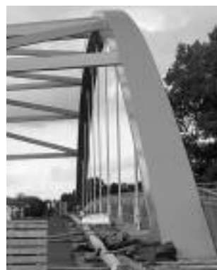
Fot. 3. Wiadukt nad torami kolejowymi w Słupsku. Wieszak bez łącznika – możliwa regulacja długości przed obciążeniem

na prostą korektę siły w cięgnie. Pośrednim systemem, który zastosowano w wiadukcie w Słupsku w ciągu nowo budowanej łącznicy DK 6 i DK 21, jest typowe rozwiązanie sworzniowe pozbawione możliwości naciągania . Zastosowanie gwintów przeciwnych na głowicach umożliwia wybranie luzów i niewielkie wstępne napięcie (fotografia 3). Ostatecznie siły pojawiają się w wieszakach po zwolnieniu przęsła z podpór tymczasowych. System ten, podobnie jak rozwiązanie spawane, nie przewiduje regulacji siły w wieszaku. W przypadku wiaduktu łukowego nad torami PKP w Słupsku po zwolnieniu przęsła z podpór montażowych okazało się, że jeden z wieszaków pozostał nienapięty, co potwierdziły badania. W artykule opisano nietypowy sposób napięcia tego wieszaka bez ingerencji w konstrukcję wiaduktu.