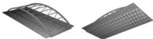
Rys. 3. Model obliczeniowy wiaduktu w środowisku MES SOFiSTiK Fig. 3. Numerical model of viaduct in the FEM SOFiSTiK

wania pomocniczej konstrukcji oraz mobilizacji sprzętu hydraulicznego do napinania. Dodatkowa trudność wynika z dużego zakresu naprawy powierzchni stalowej konstrukcji po operacji.