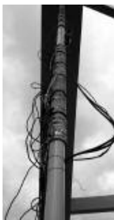
Fot. 4. Nagrzewanie wieszaka indukcyjnymi matami grzewczymi

F [N] – siła normalna w cięgnię; p [kg/m] – liniowa gęstość masy; L [m] – długość cięgna; E [MPa] – moduł sprężystości cięgna; S [m 2 ] – przekrój nośny cięgna; f [m] – strzałka ugięcia cięgna.