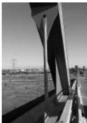
Fot. 2. Wieszak całkowicie spawany – brak regulacji

Photo 1. Standard hanger with tensioning sleeve