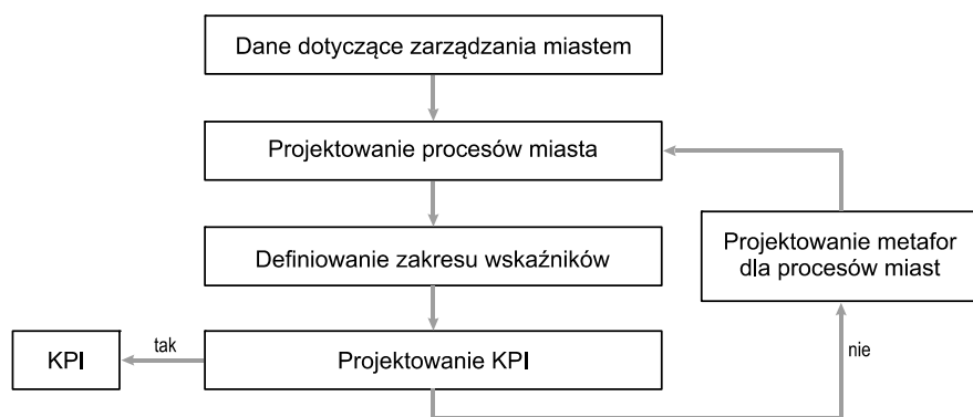
Rys. 1. Wysokopoziomowy model projektowania wskaźników KPI

Na rysunku 1 przedstawiono WPMPW na którym widoczne są trzy warstwy (modele miasta, wskaźników zagregowanych oraz wskaźników KPI, które stanowią podstawę do pomiaru tych procesów miasta, istotnych z punktu widzenia modeli miasta). Wektor sprzężenia zwrotnego widoczny na tym rysunku oraz regulator znajdujący się po prawej stronie wskazuje kierunek i obszar procesów projektowania. To model miasta stanowi swoistego rodzaju dane niezbędne dla projektowania wskaźników. Na podstawie modelu miasta wybiera się procesy i przyporządkowuje tym procesom miary. Wówczas agregowanie wskaźników odbywa się w oparciu o procesy wyodrębnione w ramach modeli i przyporządkowuje się im odpowiednie miary.