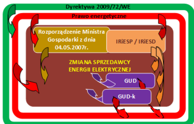
Rys. 3. Otoczenie prawne zmiany sprzedawcy energii

Te dwa kluczowe zapisy zostały przeniesione na grunt polskiego prawodawstwa poprzez ich implementację w PE, odpowiednio w art. 4 ust. 2 oraz w art. 4j ust. 6. Przy czym można mieć wątpliwości, w zakresie drugiego z przywołanych artykułów. Wynikają one z faktu, iż zgodnie z jego zapisami dystrybutorzy umożliwiają odbiorcy zmianę sprzedawcy nie później niż w terminie 21 dni licząc od dnia poinformowania danego dystrybutora o zawarciu USE lub UK. Zatem, w terminie 21 dni powinny zostać zrealizowane wszystkie wymagane działania prowadzone przez dystrybutora w ramach procesu zmiany sprzedawcy, tak aby zgodnie z zapisami [4] doszło do terminowej zmiany sprzedawcy. Tymczasem, zgodnie z określonymi w IRiESD procedurami zmiany sprzedawcy (ich szczegóły nie są przedmiotem rozważań zawartych w artykule), jednym z ich wymagań jest zawarcie UŚUD, która to umowa, co do zasady powinna być zawarta na dzień złożenia powiadomienia o zawarciu USE, czyli na dzień od którego liczony jest 21-dniowy termin realizacji procesu zmiany sprzedawcy. Pojawia się więc dodatkowe obwarowanie wskazanego w [4] terminu trzech tygodni, o którym w przedmiotowej dyrektywie nie ma mowy.