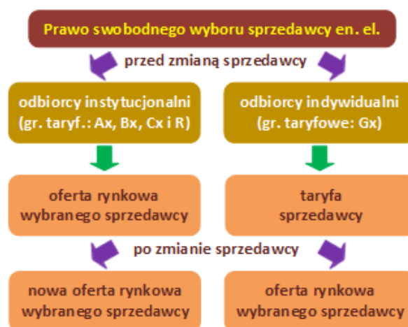
Rys. 2. Prawo swobodnego wyboru sprzedawcy - zasady rozliczeń

obszarem przejętego Vattenfall Distribution Poland S.A.) ceny regulowane w odniesieniu do odbiorców w gospodarstwach domowych. Odmienne stanowisko, w oparciu m. in. o informację Prezesa URE z dnia 28.06.2001r. [5] prezentuje RWE Polska S.A., która dla wszystkich swoich odbiorców stosuje ceny rynkowe, zatwierdzone jedynie decyzjami upoważnionych do tego organów przedsiębiorstwa [14]. Zatem, generalnie odbiorcy w gospodarstwach domowych nie funkcjonują w pełnych warunkach rynku konkurencyjnego, gdyż „zachowując” sprzedawcę z urzędu (historycznego), ich cena energii nie wynika z oferty rynkowej, a z zatwierdzanej przez Prezesa URE taryfy dla energii elektrycznej. Konsekwencją powyższego jest „ochrona” odbiorców indywidualnych przed mechanizmami rynkowymi np. „rynkowymi” podwyżkami cen energii. W związku z tym, decydując się na zmianę sprzedawcy odbiorca indywidualny zamienia taryfę na rynkową ofertę wybranego sprzedawcy. W celu zwiększenia przejrzystości opisu, powyższe zilustrowano na rysunku 2.