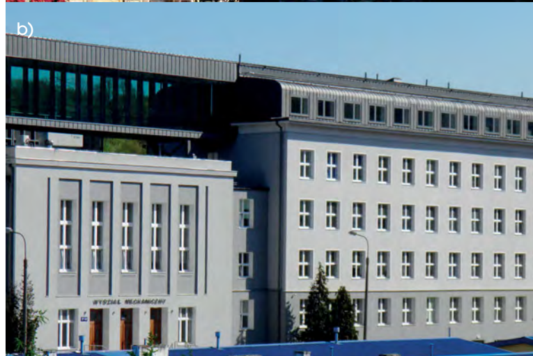
Rys. 2. Nadbudowa istniejących budynków (fot. D. Kowalski) a) obiektu użyteczności publicznej – Warszawa, b) budynek Wydziału Mechanicznego Politechniki Gdańskiej