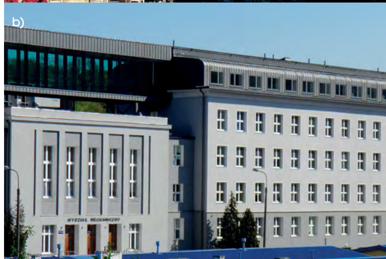
Rys. 2. Nadbudowa istniejących budynków a) obiektu użyteczności publicznej – Warszawa, b) budynek Wydziału Mechanicznego Politechniki Gdańskiej