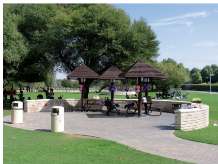
Fot. 11. Creek Side Park, Dubaj. Zacienione miejsca są w tym klimacie niezbędne