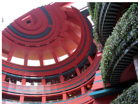
Fot. 13. Canal City Hakata, Fukuoka. Woda płynąca przez budynek i ostry kolor wewnętrznej elewacji tworzą widowiskowe przestrzenie