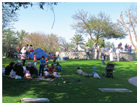
Fot. 12. Creek Side Park, Dubaj. Urządzona przestrzeń publiczna sprzyja integracji

Te dwa, jakże odmienne przykłady, dowodzą zasadności decyzji na rzecz poprawy jakości życia przez tworzenie atrakcyjnego krajobrazu miejskich parków. Można by je mnożyć, wymieniając chociażby parki nadwodne stworzone na terenach poportowych w Montrealu, Barcelonie czy Kopenhadze. Jednak prawdziwym wyzwaniem dla projektantów i zarządców zieleni miejskiej są trudne warunki klimatyczne i wodne. Przykładem pokonywania