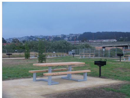
Fot. 6. Miejsca piknikowe dla osób indywidualnych i grup wyposażono w grille, siedziska oraz stoły