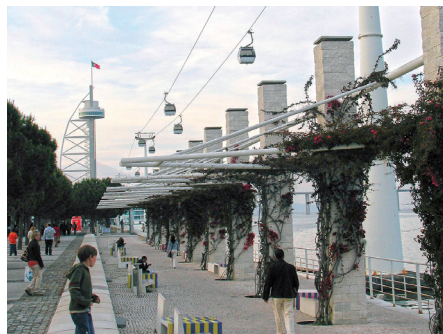
Fot. 2. Atrakcjami są kolejka linowa wzdłuż nabrzeża oraz wieża widokowa umożliwiające percepcję niezwykłego krajobrazu, w którym najważniejszym motywem jest woda