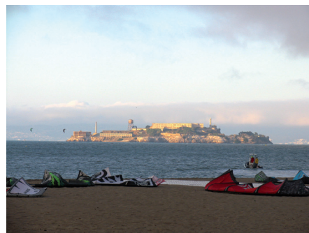
Fot. 8. Przyciągają tu nie tylko piękne widoki na Golden Gate, słynne więzienie Alcatraz i zatoka San Francisco, ale też możliwość obserwacji imprez i zawodów sportowych związanych z wodą

Do tej pory park odwiedziło ponad 10 mln osób. Rocznie korzysta z niego 1 mln ludzi, dziennie ponad 2,5 tys. Crispy Field stało się niezwykle popularnym miejscem odpoczynku, rekreacji i sportu. Dzięki projektowi nastąpiło połączenie dotychczas odizolowanego miasta z wodą. Co roku realizowane są