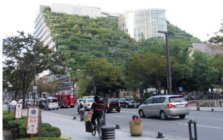
Fot. 14. Fukuoka. ACROS. Zielona architektura z tarasowymi zielonymi ogrodami organicznie wtapia się w otoczenie budynku