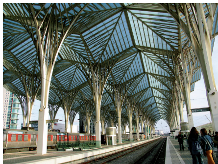
Fot. 1 3 . Lizbona. Zwiewna konstrukcja dworca kolejowego, nawiązująca do motywów roślinnych stała się wizytówką i znakiem rozpoznawczym nie tylko Expo'98 i Lizbony, ale też całej Portugalii

100 tys. rodzimych roślin z 73 rodzimych gatunków. Usunięto 70 akrów asfaltu i wielką ilość niebezpiecznych materiałów. Rozciągający się wzdłuż wybrzeża obszar podzielono na strefy funkcjonalne. Wykopano sztuczny zbiornik wodny.