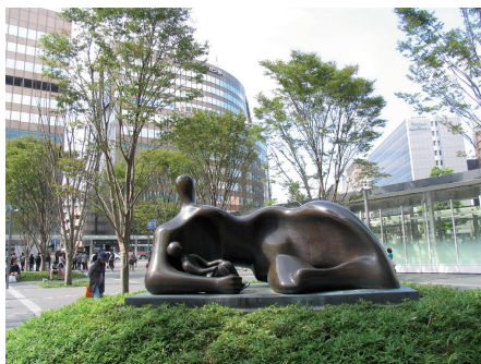
Fot. 16. Przykładem sztuki w przestrzeni publicznej jest rzeźba „Dropped Reclining Mother and Baby”

Ćwierć wieku temu ustanowiono „The Fukuoka City Urban Beautification Awards” (w dowolnym tłumaczeniu Nagrodę urbanistycznego upiększania miasta Fukuoki ), promującą wybitne obiekty i działania wpływające na poprawę estetyki przestrzeni. W dwudziestą rocznicę, w 2007 r., opracowano „mapę wizualnych atrakcji Fukuoki”, na której zaprezentowano elementy z zakresu architektury, krajobrazu miejskiego i otwartego oraz sztuki ulicznej, które przyczyniają się do wzmocnienia sfery publicznej miasta [ Visual Delights... ]. Zaprezentowano na niej przede wszystkim ikony architektury zaprojektowane przez słynnych japońskich i zagranicznych architektów. Wśród nich należy wymienić wielkie centrum usługowe Canal City Hakata, autor-