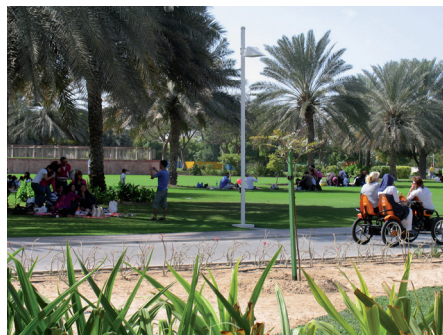
Fot. 10. Wielkość parku sprzyja „podróżom” specjalnymi pojazdami lub kolejką linową zawieszoną na odcinku 2,3 km, na wysokości 25 m