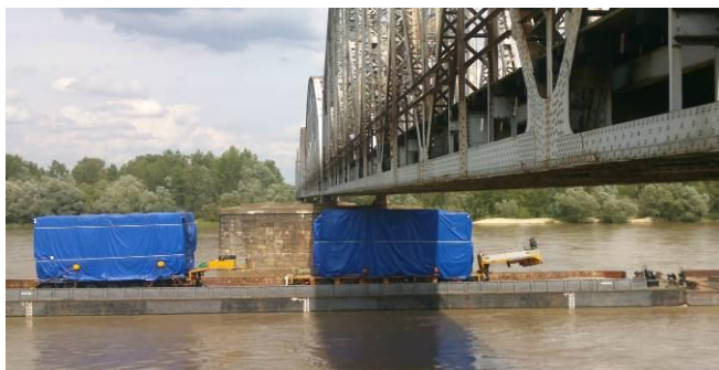
Rys. 1. Transport ładunku na Wiśle

Celem obecnych kierunków i tendencji rozwoju, a także polityki Unii Europejskiej dotyczącej żeglugi śródlądowej jest przystosowanie śródlądowych dróg wodnych do współczesnych potrzeb żeglugi, spedycji i turystyki oraz wykorzystanie infrastruktury śródlądowej do celów transportu intermodalnego jako elementów węzłów przeładunkowych i spedycyjnych.