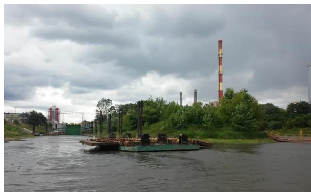
Rys. 3. Wejście na Kanał Żerański

Dolna Wisła obejmuje odcinek liczący 390 km od ujścia Narwi (km 551) do ujścia Wisły do morza (km 941). Do dolnej Wisły można zaliczyć aglomerację Warszawską ze zbiornikiem Zegrzyńskim i Kanałem Żerańskim (Rys. 3). Powierzchnia dorzecza dolnej Wisły wynosi 34,3 tys. km 2 . Narew łącznie z dopływem Bugu i Wkry jest największym dopływem Wisły zmieniającym w sposób zasadniczy natężenie przepływu w głównym korycie rzeki. Tuż poniżej ujścia Narwi znajduje się przekrój wodowskazowy Modlin.