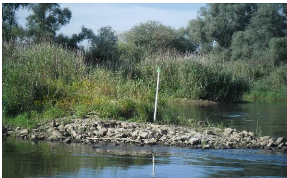
Rys.2 Budowla regulacyjna na Odrze

Omawiany odcinek rzeki Odry rozpoczyna się od ujścia Nysy Łużyckiej (km 542,4). Jest to jednocześnie początek granicznego odcinka Odry. Od tego miejsca granica państwa przebiega wzdłuż nurtu Odry, aż do Widuchowej (km 704,1), gdzie w miejscu rozdziału rzeki na dwa koryta, przechodzi na Odrę Zachodnią, którą biegnie do km 17,1 (Gryfino), aby przejść z rzeki na obszar lądowy i Odrę Wschodnią.