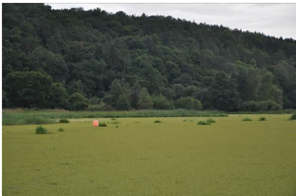
Rys. 5. Rzeka Nogat sierpień 2016

łach do około 1,30 m. Sam w sobie problem z punktu żeglugowego stanowi przekop Wiślany. Wisła jest powiązana z portem gdańskim przez służę w Przegalinie, natomiast nie ma jeszcze bezpośrednio połączenia z Portem Północnym, z Zalewem Wiślanym jest natomiast połączona przez służę w Gdańskiej Głowie i rzekę Szkarpawę lub przez Służę w Białej Górze i rzekę Nogat (Rys. 5) [1].