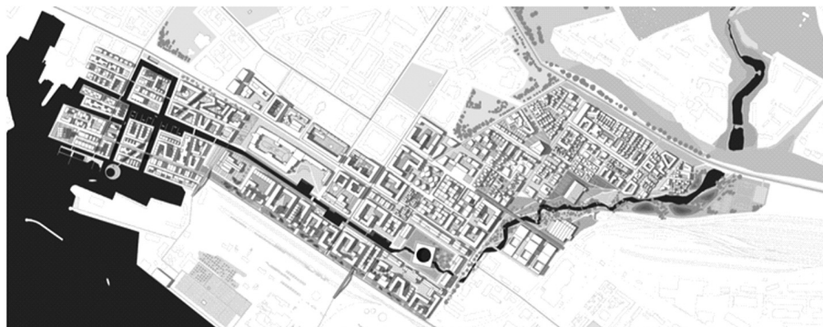
Fot. 3. Projekt transformacji obszaru położonego we wschodniej części miasta Helsingborg – The Tolerant City