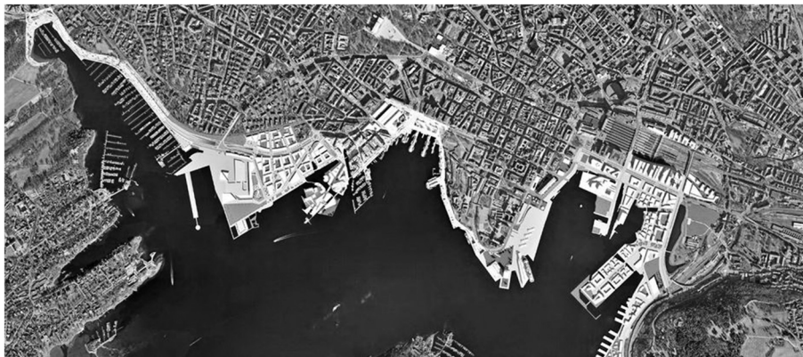
Fot. 2. Nadwodna strefa przekształceń w Oslo – system głównych ciągów pieszych, łączący uwolnione tereny ze strukturą miasta