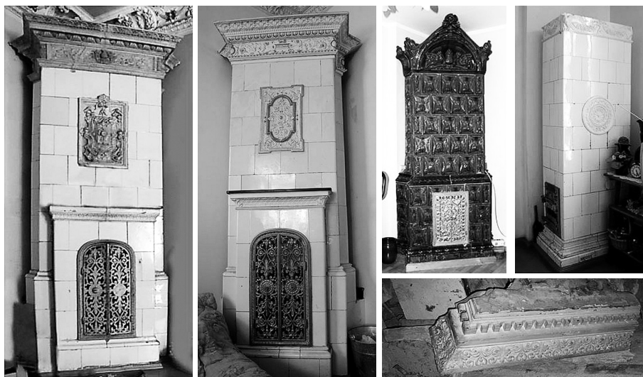
Fot. 4. Studencka inwentaryzacja fotograficzna wybranych pieców kaflowych na Dolnym Mieście w Gdańsku

Wolontariackie prace inwentaryzacyjne realizowane przez studentów i członków stowarzyszenia dotyczą także większych kubaturowo obiektów, których istnienie pozostaje zagrożone. W ostatnich latach zrealizowane zostały np. rysunkowe i fotograficzne opracowania architektoniczne zabytkowego i opuszczonego dworu Uphagenów z końca XVII w. (ryc. 1.) oraz kilku kamienic z okresu przełomu XIX i XX w. Działania te, poza walorami dokumen-