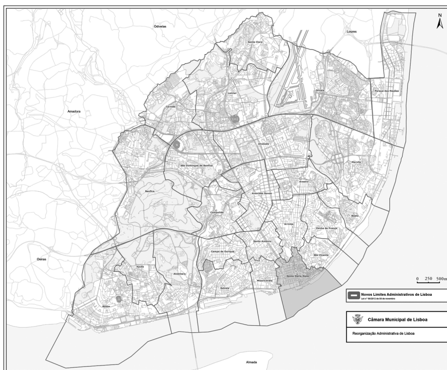
Ryc. 1. Podział administracyjny Lizbony oraz obszar Junta de Freguesia Santa Maria Maior

Dzielnica Mouraria zlokalizowana jest w ścisłym centrum Lizbony i stanowi jedną z najbardziej ‘tradycyjnych’ dzielnic miasta. Terytorium