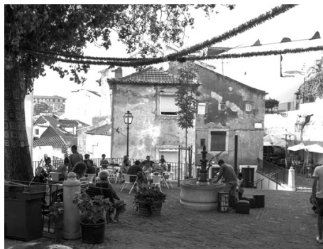
Fot. 1. Largo dos Trigueiros, przy fontannie ogólnodostępny regał z książkami i miejsce do czytania