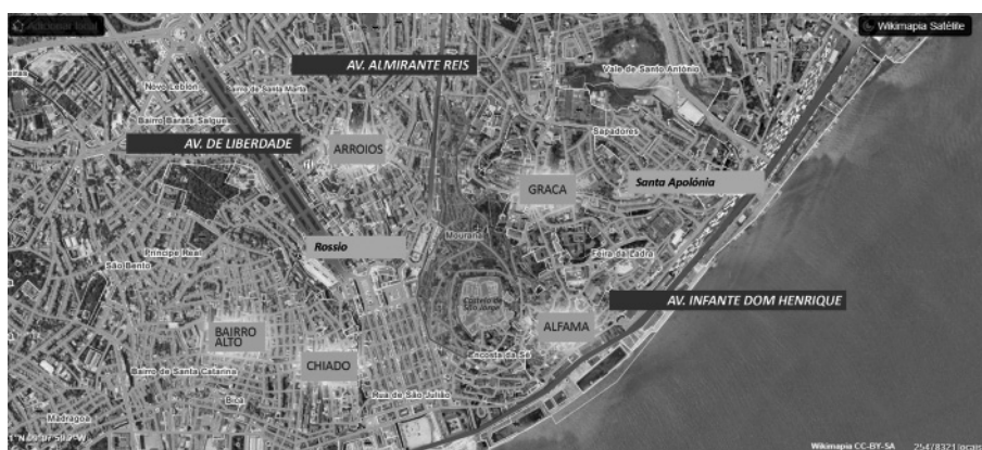
Ryc. 2. Obszar dzielnicy Mouraria z oznaczeniem dzielnic sąsiadujących oraz głównych arterii i węzłów komunikacyjnych (dworce Santa Apolonia i Rossio)

Populacja dzielnicy starzeje się w porównaniu do całego kraju, przy relatywnie większym odsetku młodych ludzi, głównie wśród imigrantów. Mouraria reprezentuje obszar dużej gęstości zaludnienia, gdzie prawie 20% ludności żyje w mieszkaniach przeludnionych. Niski poziom wykształcenia towarzyszy bardzo wysokiemu wskaźnik analfabetyzmu, z najwyższym poziomem wśród populacji kobiet (6,81%), jakkolwiek ze znacznym ogólnym odsetkiem absolwentów szkół: 4,17% w stosunku do całej Lizbony 1,81% i 1,71% dla Portugalii. Stopa bezrobocia wynosi ok. 13% (poziom wyższy dla mężczyzn: 14% niż kobiet: 12,5%). Charakterystyczny jest też duży odsetek