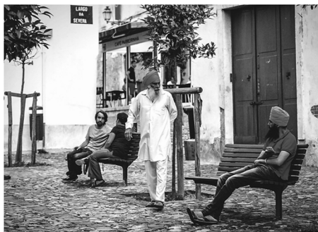
Fot. 3. Nowe zagospodarowanie skweru Largo da Severa. Wprowadzenie zieleni i elementów umeblovania przestrzeni publicznej zostało bardzo dobrze przyjęte przez mieszkańców dzielnicy

Ankieta przeprowadzona przez Bettencourt i Castro na próbie 22 osób, składającej się z 14 „tradycyjnych” mieszkańców, 6 „nowych” mieszkańców nazwanych gentryfiers oraz 2 imigrantów [Bettencourt, Castro 2015] pokazuje, że silnie odczuwalna jest niewystarczająca, w opinii mieszkańców, konsultacja miasta w kwestii założeń projektu i działań rehabilitacyjnych, co sprawia, że nie czują się oni w dużej mierze adresatami wprowadzanych zmian. Widoczna postępująca gentryfikacja oraz zwiększona liczba biznesów prowadzonych przez imigrantów budzi wśród ankietowanych obawy dotyczące utraty tradycyjnej tożsamości dzielnicy. Ankieta przeprowadzona przez autorkę na potrzeby prezentowanego opracowania na próbie 49 osób (21 pochodzenia portugalskiego, 28 imigrantów) pokazuje również duże zróżnicowanie w odbiorze prowadzonych działań – jakkolwiek kierowanie oficjalnej tożsamości dzielnicy w stronę związaną z tradycją fado jest bardzo dobrze odbierane, pozostałe działania są odbierane w sposób zdecydowanie bardziej negatywny wśród starszej