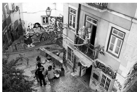
Fot. 2. Uliczki dzielnicy często przyjmują formę schodów. Mouraria, widok z Largo São Cristóvão w kierunku Travesa da Madalena

Początki dzielnicy sięgają XII w. Nazwa dzielnicy wywodzi się z faktu przesiedlenia na ten obszar populacji Maurów po zdobyciu miasta przez chrześcijan. W wyniku tych działań przesiedleńczych, na wzgórzu wokół zamku wytworzyła się struktura miejska o specyficznych cechach i typie zabudowy. Budynki usytuowane są na nieregularnej siatce odpowiadającej morfologii terenu. Charakterystyczna jest instensywna zwarta zabudowa przepleciona gęstą siecią wąskich uliczek, które ze względu na duże różnice wysokości często przyjmują formę schodów (fot. 2). Dzielnica jest kojarzona z klasą robotniczą i bogatą historią ruchów migracyjnych, będących nieodłączną częścią dziedzictwa multikulturowej Lizbony. Naznaczona jest jednak