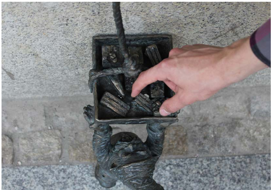
Fig. 10. Wrocław's dwarfs – Ciastuś.

Wrocław Dwarfs (Fig. 10) began to appear in the city since 2005. Currently there are over 300 of them and this number is still growing. They derive from a graffiti from the 80s of the 20th century, which were intended to ridicule the communist system. At this moment, very few know where these little sculptures come from - even the official website of Wrocław Dwarfs does not have information about this. However, they fulfill a valuable function - they are a unique way to promote of the city.