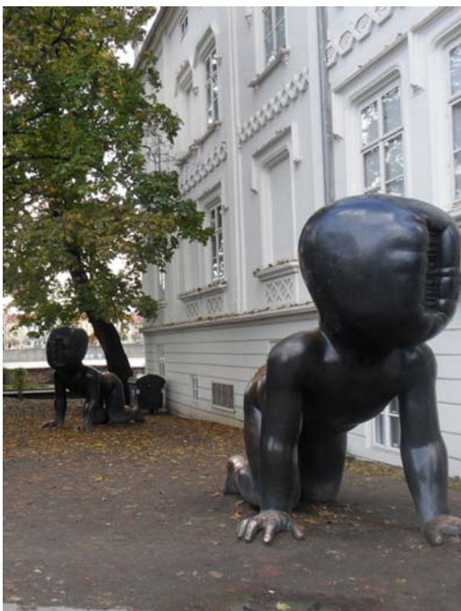
Fig. 9. Infants by David Černý in the Kampa park in Prague.

Ryc. 8. Mimininka autorstwa Davida Černego – Wieża telewizyjna Žižkov w Pradze.