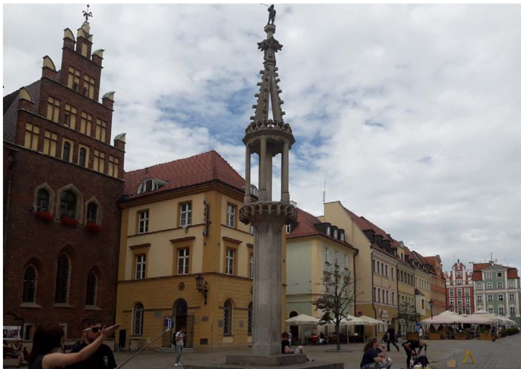
Fig. 5. Replica of a pillory on the Old Market Square in Wrocław. Ryc. 5. Replika Pręgierza na Starym Rynku we Wrocławiu.

There are sculptures, whose main purpose is to teach all kinds of people about the city itself. Such objects are, for example, touch models of important buildings (Fig. 6, 7), made on a scale and cast of bronze. They allow passersby to easily understand how the whole object looks. In addition, they are a spatial element that especially attracts the attention of visitors who want to get acquainted with the history of a given place.