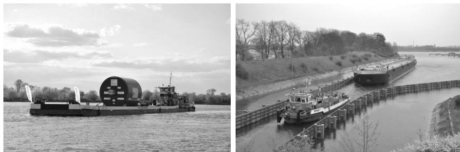
Rys. 4. Żegluga śródlądowa na Wiśle