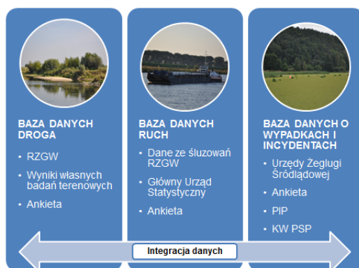
Rys. 1. Bazy danych dotyczące żeglugi śródlądowej na Dolnej Wiśle

W wyniku prowadzonych badań stworzono bazę danych integrującą dane o drodze wodnej, ruchu jednostek oraz wypadkach i incydentach (rys. 1).