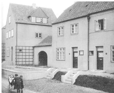
Fot. 3. Zabudowa mieszkaniowa w Gartenstadt Steenkamp, 1920

Pozostałe osiedla modernistyczne w Gdańsku nie tworzą już tak zwartych i rozległych zespołów urbanistycznych. Poza Wrzeszczem jedynie w Siedlcach powstała nowa dzielnica mieszkaniowa o zróżnicowanej intensywności i formie zabudowy. Inne osiedla realizowano przeważnie w formie niewielkich zespołów zabudowy jednorodzinnej o skali od jednej do kilku ulic. Była to najczęściej zabudowa o tradycyjnych cechach architektury, jednorodząwa wzdłuż ulic, z kalenicami prostopadle lub równoległe do osi jezdni, choć pojawia się też forma zabudowy kwartałowej, w formie obrzeżnie zabudowanego czworoboku, co może przywoływać idee wiedeńskich