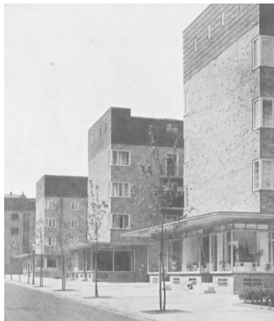
Fot. 5. Zespół mieszkaniowy Helmholtz-Bunsentraße zaprojektowany przez G. Oelsnera według nowoczesnych zasad urbanistyki, 1928. W parterach widoczne przeszklone pawilony usługowe, które przydają lekkości masywnej zabudowie i klinkierowym elewacjom