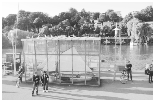
Fot. 1. Altona – bulwary nad Łabą będące elementem systemu zieleni miejskiej stworzonego przez Gustava Oelsnera we współpracy z Maxem Brauerem. Stan obecny Źródło: [B. Macikowski].

wanego centrum do nowych osiedli budowanych na zachodnich obrzeżach miasta, pełnych świeżego powietrza i słońca. W ten sposób, dzięki przeważającym zachodnim wiałom, mieszkańcy mieli być pozbawieni szkodliwego wpływu smogu i dymów znad przemysłowej i portowej strefy Altony, jak również i znad samego Hamburga, położonych na wschód od Altony. Oelsner wspierał budownictwo komunalne i opracował nowy program architektoniczny dla budownictwa socjalnego i terenów zieleni miejskiej. Wraz z Maxem Brauerem, nadburmistrzem Altony, udało się zrealizować system zielonych korytarzy dla miasta i stworzyć siedem parków publicznych na terenach zakupionych na ten cel przez władze miejskie. Stworzony wówczas system zieleni miejskiej do dziś formuje zasadniczy rdzeń zielonych przestrzeni publicznych miasta, budując jego przyjazny mieszkańcom charakter [Kostrzewska 2016]. W okresie Wielkiego Kryzysu, po 1923 r., mimo trudności ekonomicznych, Oelsnerowi udało się stworzyć pierwszą spółdzielnię mieszkaniową SAGA, która do dzisiaj administruje 130 tys. mieszkań w Hamburgu [Michelis 2008] (fot. 1).