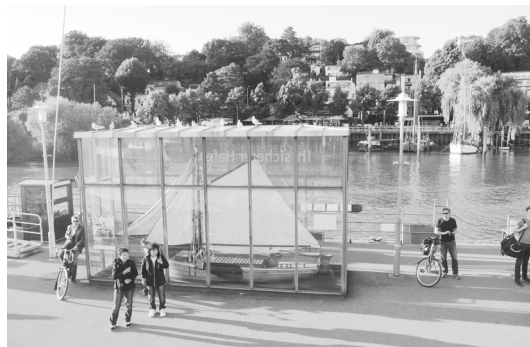
Fot. 1. Altona – bulwary nad Łabą będące elementem systemu zieleni miejskiej stworzonego przez Gustava Oelsnera we współpracy z Maxem Brauerem. Stan obecny Źródło: [B. Macikowski].

wanego centrum do nowych osiedli budowanych na zachodnich obrzeżach miasta, pełnych świeżego powietrza i słońca. W ten sposób, dzięki przeważającym zachodnim wiałom, mieszkańcy mieli być pozbawieni szkodliwego wpływu smogu i dymów znad przemysłowej i portowej strefy Altony, jak również i znad samego Hamburga, położonych na wschód od Altony. Oelsner wspierał budownictwo komunalne i opracował nowy program architektoniczny dla budownictwa socjalnego i terenów zieleni miejskiej. Wraz z Maxem Brauerem, nadburmistrzem Altony, udało się zrealizować system zielonych korytarzy dla miasta i stworzyć siedem parków publicznych na terenach zakupionych na ten cel przez władze miejskie. Stworzony wówczas system zieleni miejskiej do dziś formuje zasadniczy rdzeń zielonych przestrzeni publicznych miasta, budując jego przyjazny mieszkańcom charakter [Kostrzewska 2016]. W okresie Wielkiego Kryzysu, po 1923 r., mimo trudności ekonomicznych, Oelsnerowi udało się stworzyć pierwszą spółdzielnię mieszkaniową SAGA, która do dzisiaj administruje 130 tys. mieszkań w Hamburgu [Michelis 2008] (fot. 1).