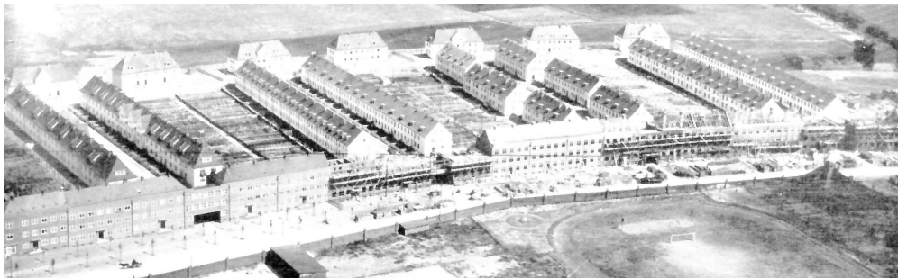
Fot. 2. Gdańsk-Wrzeszcz, północna pierzeja Ringstrasse w trakcie budowy, arch. Martin Kießling i Albert Krüger. Widoczna zwarta zabudowa podkreślająca przebieg ulicy i szeregową zabudowę linijkową wewnątrz bloku urbanistycznego.

i urbanistykę niemiecką, choć z zauważalną już dbałością o rozwiązania funkcjonalne postulowane przez modernistów, zapewniające odpowiednie warunki nasłonecznienia i przewietrzania, orientację względem stron świata, odległości w zabudowie, dostęp do zieleni, a także umiarkowane wskaźniki intensywności zabudowy.