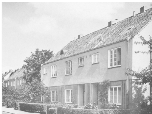
Fot. 4. Rozbudowa osiedla Steenkamp przez G. Oelsnera, 1925/26.