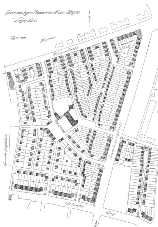
Ryc. 3. Plan rozbudowy miasta-ogrodu Steenkamp w Altonie, 1915, arch. F. Neugebauer Źródło: [ http://books.openedition.org/psorbonne/docannexe/image/525/img-15.jpg ].

pozycji, osiowość, dbałość o kształtowanie wnętrza urbanistycznych, strome dachy kryte dachówką, zabudowa o skali i charakterze bardziej wiejskim niż miejskim – te cechy kompozycji urbanistycznej były raczej negowane przez modernistów awangardowych lub tych reprezentujących styl międzynarodowy, niemniej znakomicie wpisywały się w ideę howardiańską. W planie zabudowy widać dążenie do liniowego kształtowania zabudowy w układzie północno-południowym. Każdy z domów był dwukondygnacyjny, o skromnej, ale wystarczającej dla jednej rodziny powierzchni 70 m 2 . Wszystkie ogródki frontowe miały być obsadzone roślinnością w ten sam sposób, aby manifestować motto tego miasta-ogrodu, które brzmiało: „prostota, równość, przejrzystość i wspólnota” [Michelis 2008] (fot. 2, 3, 4).