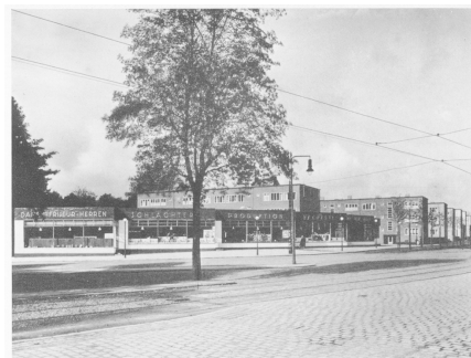
Zeilenbauten mit Ladenfronten an der Luruper Chaussee in Bahrenfeld (Mitarbeiter E. Schröder) 1925/26