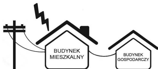
Rys. 2. Schemat zabudowań mieszkalno-użytkowych

Budynek mieszkalny wraz z niewielkim budynkiem gospodarczym, podłączone napowietrzną linią energetyczną, zlokalizowane na skraju miejscowości, w bliskiej odległości lasu i niewielkiego zbiornika wodnego.