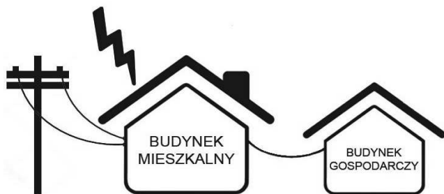
Rys. 2. Schemat zabudowań mieszkalno-użytkowych

Budynek mieszkalny wraz z niewielkim budynkiem gospodarczym, podłączone napowietrzną linią energetyczną, zlokalizowane na skraju miejscowości, w bliskiej odległości lasu i niewielkiego zbiornika wodnego.