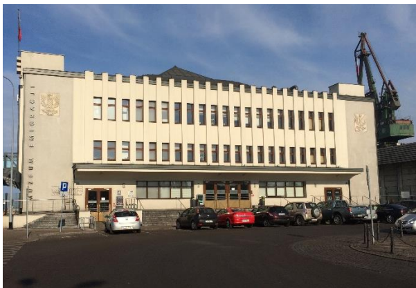
Ilustracja 6. Modernistyczny budynek dawnego Dworca Morskiego aktualnie jest siedzibą Muzeum Emigracji 22 .

Wartością działań adaptacyjnych jest wykorzystywanie obiektów i ich historii do eksponowania przeszłości miejsca, związanych z nim wydarzeń, tworząc wyjątkową ekspozycję wpisującą się w nurt muzeum narracyjnego. Ponadto nowa funkcja w rejonie miasta, dość odległym od ścisłego centrum jak ma to miejsce np. w Gdyni, skłania gości muzeum do poznania nowego dla nich rejonu miasta. Architektura obiektu adaptowanego ma wartość równoważną z ekspozycją, stanowiąc jej integralny element.