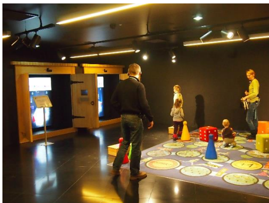
Ilustracja 7. Ekspozycja skierowana do dzieci w Interaktywnym Centrum Historii Ostrowa Tumskiego 23 .

zmierzającymi do niwelowania barier w odbiorze przekazywanych treści. Dotyczy to wszystkich grup odbiorców jednak jest to szczególnie zauważalne w odniesieniu do najmłodszych gości. Wiele wystaw jest tworzonych z myślą o dzieciach jako obecnych i przyszłych odbiorcach dla których w muzeach przewiduje się specjalne pomieszczenia z ekspozycją (Il. 7).