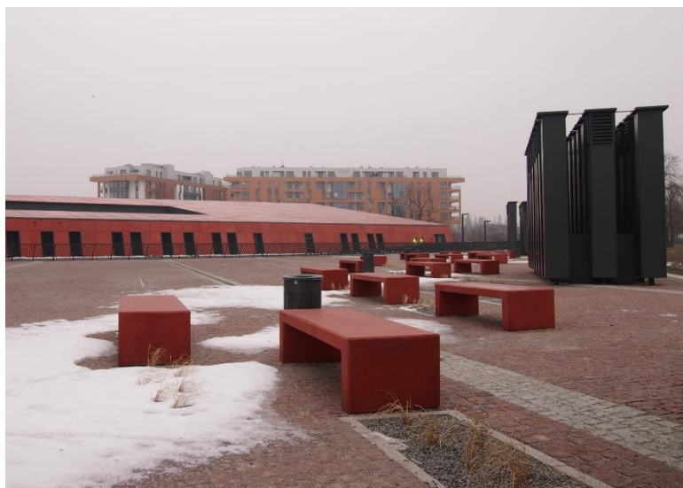
Ilustracja 2. Plac przed Muzeum II Wojny Światowej z widocznym w tle nowym osiedlem mieszkaniowym Brabank 12 .

Projekt muzeum już w fazie koncepcyjnej został określony przez sąd konkursowy jako „nowy symbol Gdańska” i jego „nowa ikona” 11 . Wyjątkowa architektura prawdopodobnie spowoduje, że to muzeum stanie się budowlą identyfikującą miasto.