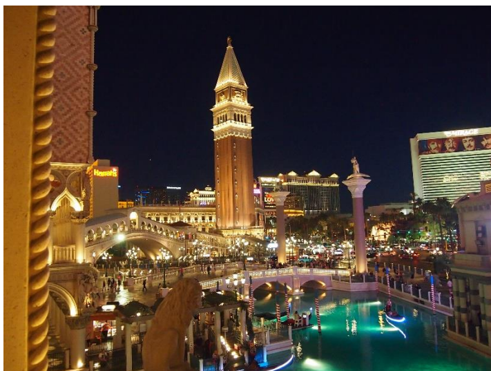
Ilustracja 5. Nocny widok na budynki w sąsiedztwie siedziby Muzeum Guggenheima w Las Vegas. 21

Muzeum Guggenheima jest marką, za którą kryją się światowe dzieła sztuki, a ich siedziby w Nowym Jorku i Bilbao są przykładami spektakularnych rozwiązań architektonicznych. Jednak Fundacja Guggenheima podejmowała próby lokalizowania swoich filii w różnych miejscach, w tym w Las Vegas. Próby te nie zawsze odnosiły sukces, jak np. w Brazylii, Singapurze czy Hongkongu, gdzie muzea szybko zostały zamknięte. Także realizacja projektu Rema Koolhaasa w Las Vegas nie odniosła spektakularnego sukcesu. Pierwotnie zaplanowana powierzchnia ekspozycyjna na siedem tysięcy metrów kwadratowych została zmniejszona do siedmiuset 20 . Sama zaś lokalizacja w centrum Las Vegas, w sąsiedztwie kasyn, repliki budynków z Wenecji mająca ściągać odbiorców spośród klientów salonów gier nie odniosła sukcesu. Również architektura muzeum nie jest w stanie wyróżnić się spośród sąsiednich budynków i reklam świetlnych.(II.5)