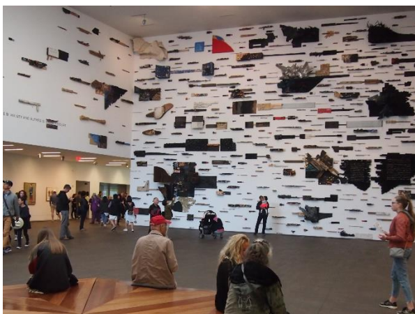
Ilustracja 1. Hall wewnętrzny muzeum sztuki De Young w San Francisco pełniący funkcję miejsca spotkań, ale i przestrzeni ekspozycyjnej 7 .

Architektura współczesnych muzeów stała się bliższa odbiorcy dzięki poszukiwaniu rozwiązań zaczerpniętych z powszechnie stosowanych materiałów wykończeniowych, których użycie zmniejsza dystans pomiędzy widzem a obiektem. Rola samej ekspozycji stała się drugoplanowa, gdyż na plan pierwszy wysunęła się architektura muzeów odpowiadająca konsumpcyjnym oczekiwaniom społeczeństwa. Włączenie muzeów w życie codzienne miast przez lokalizowanie ich w miejscach łatwo dostępnych, projektowanie tak, by były chętnie odwiedzane i poszukiwanie łączności z miastem poprzez np. wprowadzenie różnorodnych ogólnodostępnych funkcji, czynią je szczególnymi przestrzeniami publicznymi.