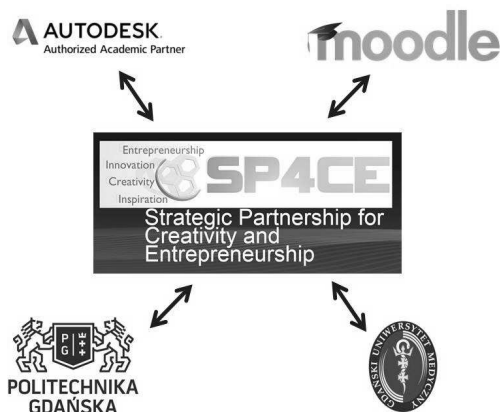
Rys. 1. Schemat współpracy partnerów projektu SP4CE

W projekcie uczestniczyli przedstawiciele dwóch uczelni wyższych – Politechniki Gdańskiej oraz Gdańskiego Uniwersytetu Medycznego, a także pracownicy kilku firm zewnętrznych, które zajmują się szkoleniami i certyfikacją. Schemat współpracy w oparciu o narzędzia e-learningowe został przedstawiony na poniższym rysunku. (Rys. 1.).