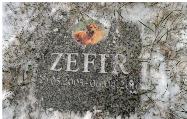
Il. 3. Gdańsk, grzebowisko Zawsze Razem – typowy nagrobek

Fig. 2. Pet cemetery Brzozowa Przystań in Mochle