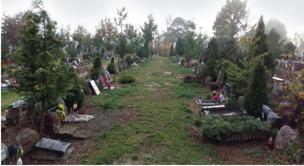
Il. 2. Grzebowisko Brzozowa Przystań, Mochle

Fig. 2. Pet cemetery Brzozowa Przystań in Mochle (source: http://brzozowaprzystan.pl/wp-content/uploads/2015/11/cmentarz_dla_zwierza_bydgoszcz-3.jpg [accessed: 7.08.2017])