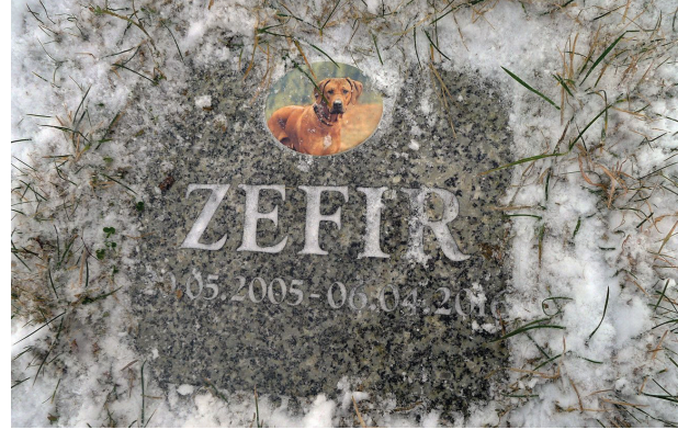
Il. 3. Gdańsk, grzebowisko Zawsze Razem – typowy nagrobek

Fig. 2. Pet cemetery Brzozowa Przystań in Mochle