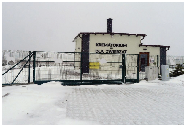
Il. 6. Gdańsk, grzebowisko Zawsze Razem