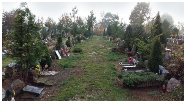
Il. 2. Grzebowisko Brzozowa Przystań, Mochle (źródło: http://brzozowaprzystan.pl/wp-content/uploads/2015/11/cmentarz_dla_zwierza_bydgoszcz-3.jpg [data dostępu: 7.08.2017])

Fig. 2. Pet cemetery Brzozowa Przystań in Mochle (source: http://brzozowaprzystan.pl/wp-content/uploads/2015/11/cmentarz_dla_zwierza_bydgoszcz-3.jpg [accessed: 7.08.2017])