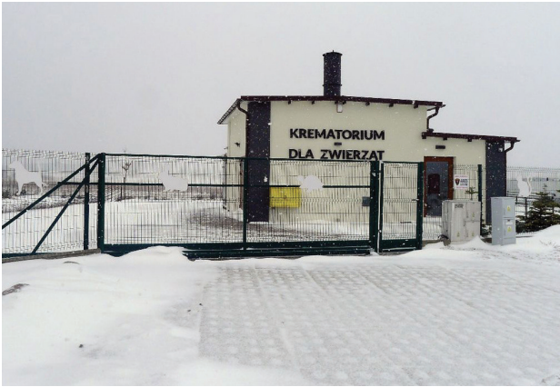
Il. 6. Gdańsk, grzebowisko Zawsze Razem