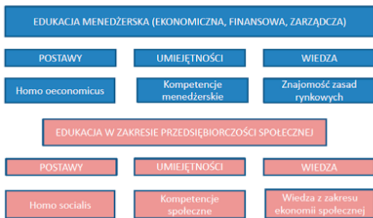
Rysunek 2. Edukacja na rzecz przedsiębiorczości na studiach biznesowych.

Tego typu model edukacji na rzecz przedsiębiorczości lub przez przedsiębiorczość możliwy jest na każdym poziomie studiów, w tym w ramach programów MBA. Na najlepszych uczelniach amerykańskich realizowane są pełne curricula z zakresu przedsiębiorczości społecznej, a ich ocena znajduje odzwierciedlenie w rankingach dotyczących tego typu programów (Burke, 2018). Niewątpliwie, takie podejście wymagałoby odpowiedniego przygotowania nauczycieli przedmiotu, to jednak nie powinno stanowić wielkiego wyzwania.