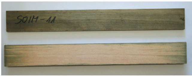
Rys. 1. Próbkę impregnowanego drewna sosnowego (nr próbki SOIM-11). Na górze pokazano powierzchnię zewnętrzną, a niżej – powierzchnię wewnętrzną po przecięciu

Właściwości materiałowe dla prostopadłego kierunku prędkości skrawania względem włókien drewna, wiążkość R_{\perp} (energii właściwą niezbędną do wytworzenia pęknięcia o powierzchni jednostkowej w trakcie skrawania – ang. fracture toughness ) oraz naprężenia tnące w strefie ścinania \tau_{Y\perp} , które wykorzystano do prognozowania wartości mocy skrawania (tabl. I), określono według metodologii opracowanej przez Orłowskiego i opisanej w pracach [11, 13] z wykorzystaniem testów skrawalnościowych na pilarsce ramowej PRW15M z eliptyczną trajektorią ostrzy oraz hybrydowym, dynamicznie wyrównoważonym układem napędowym [15].