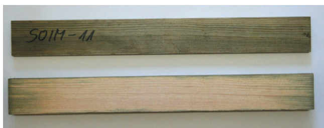
Rys. 1. Próbkę impregnowanego drewna sosnowego (nr próbki SOIM-11). Na górze pokazano powierzchnię zewnętrzną, a niżej – powierzchnię wewnętrzną po przecięciu

Właściwości materiałowe dla prostopadłego kierunku prędkości skrawania względem włókien drewna, wiążkość R_{\perp} (energii właściwą niezbędną do wytworzenia pęknięcia o powierzchni jednostkowej w trakcie skrawania – ang. fracture toughness ) oraz naprężenia tnące w strefie ścinania \tau_{Y\perp} , które wykorzystano do prognozowania wartości mocy skrawania (tabl. I), określono według metodologii opracowanej przez Orłowskiego i opisanej w pracach [11, 13] z wykorzystaniem testów skrawalnościowych na pilarsce ramowej PRW15M z eliptyczną trajektorią ostrzy oraz hybrydowym, dynamicznie wyrównoważonym układem napędowym [15].