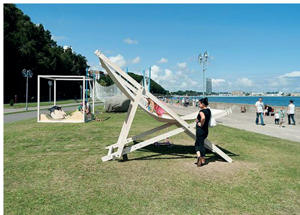
Rys. 2. „Gdynia Playground 2013”