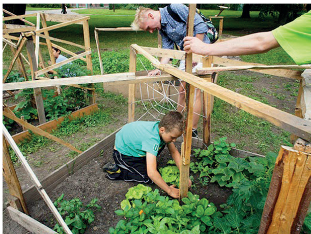
Rys. 8. Prace nad „Ogrodem Rzeźby Rolnej” przy DOMu w Elblągu

Fig. 8. Work on the ‘Agricultural Sculpture Garden’ at the Elbląg House