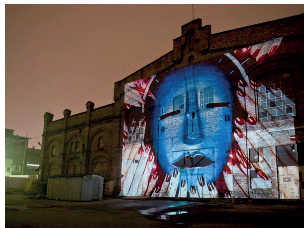
Rys. 4. „Narracje 2012”