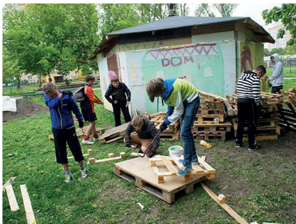
Rys. 7. Prace nad „Ogrodem Rzeźby Rolnej przy DOMu” w Elblągu

wychowaniem czy zapewnieniem możliwości pożytecznego i rozwijającego umiejętności spędzenia czasu wolnego. Podczas pracy w ogrodzie rzeźby rolnej dzieci i młodzież poznawały się nawzajem, tworzyły mikrospołeczność, uczyły się, że wspólna praca jest bardziej produktywna, ale i przyjemniejsza. Autor zachęcał uczestników do wykonywania czyn-