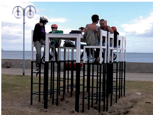
Rys. 1. „Gdynia Playground 2011”