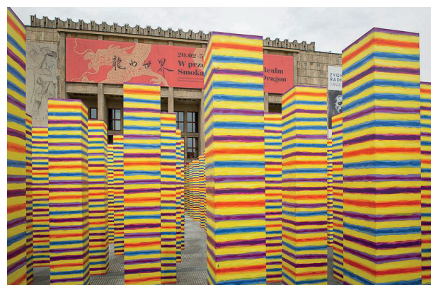
Rys. 6. Instalacja w Kielcach autorstwa Leona Tarasewicza