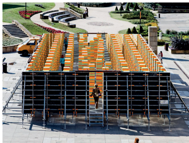
Rys. 5. Instalacja w Kielcach autorstwa Leona Tarasewicza

Plac Artystów jest typowym, niczym niewyróżniającym się kawałkiem przestrzeni miejskiej, która nie zachęca w żaden sposób mieszkańców miasta do przebywania w niej. Instalacja Tarasewicza pozwoliła kielczanom spojrzeć na ten fragment miasta z innej perspektywy. Poprzez ten projekt ożywiono przestrzeń placu i wzbudzone zaniepokojenie mieszkańców Kielc tym nietypowym jak na polskie realia projektem. Zazwyczaj działania artystyczne lokowane