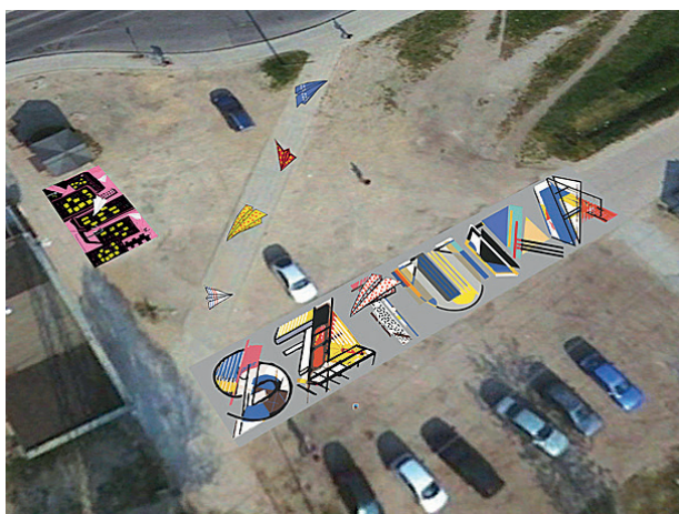
Rys. 10. Poziomy mural na Zaspie w Gdańsku Fig. 10. Horizontal murals on Zaspia in Gdansk

Zyskali oni przyjazne miejsce do spędzenia czasu wolnego oraz pokazano im, jak ważna jest praca wspólna i jeden wyraźny cel, a także jak wiele może osiągnąć zgodna wspólnota. Dzięki temu przedsięwzięciu miejsce stało się chętniej odwiedzane i użytkowane nie tylko przez mieszkańców osiedla, ale również przez innych mieszkańców Trójmiasta.